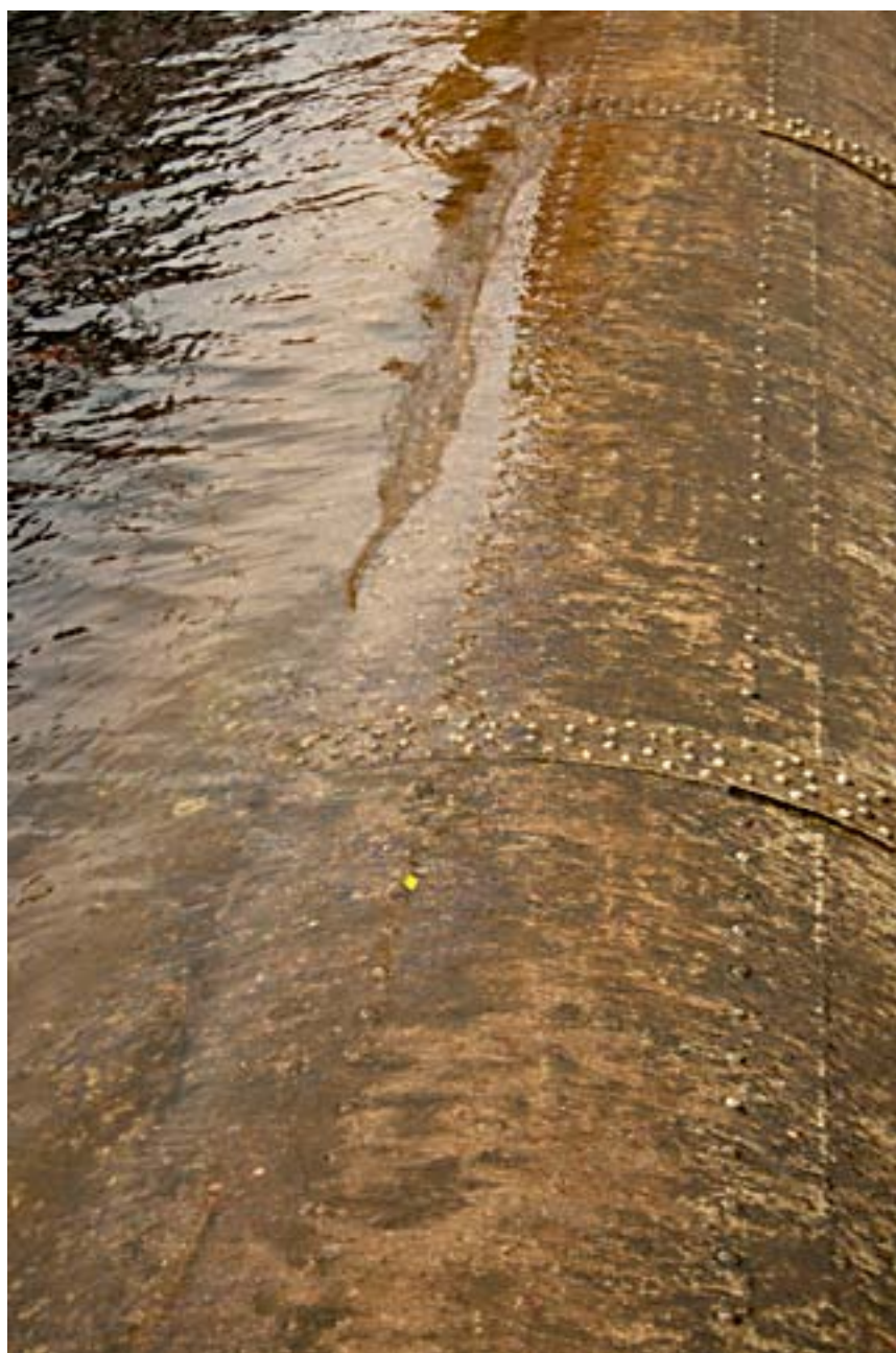
August Waters 2.