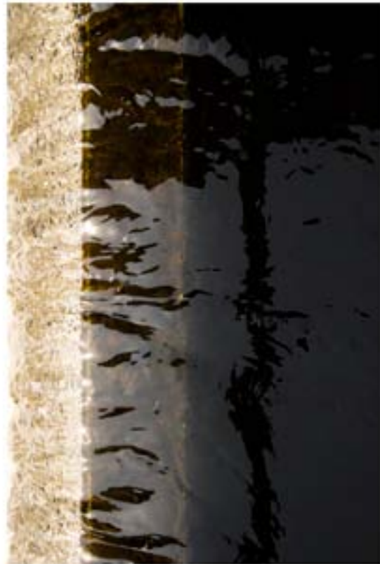
Dark Waters / mirror play Look the pictures before