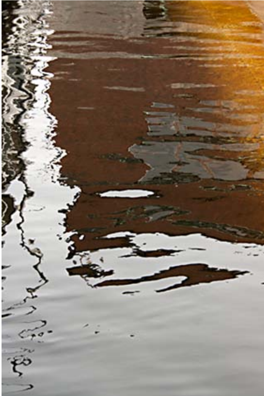
August Waters 3. Before the Fall