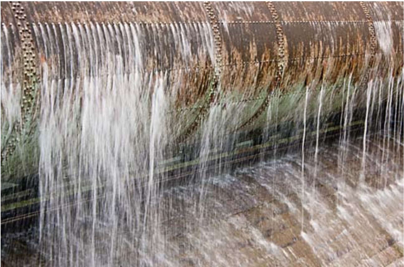
Photographs of the Lad, 76x100cm