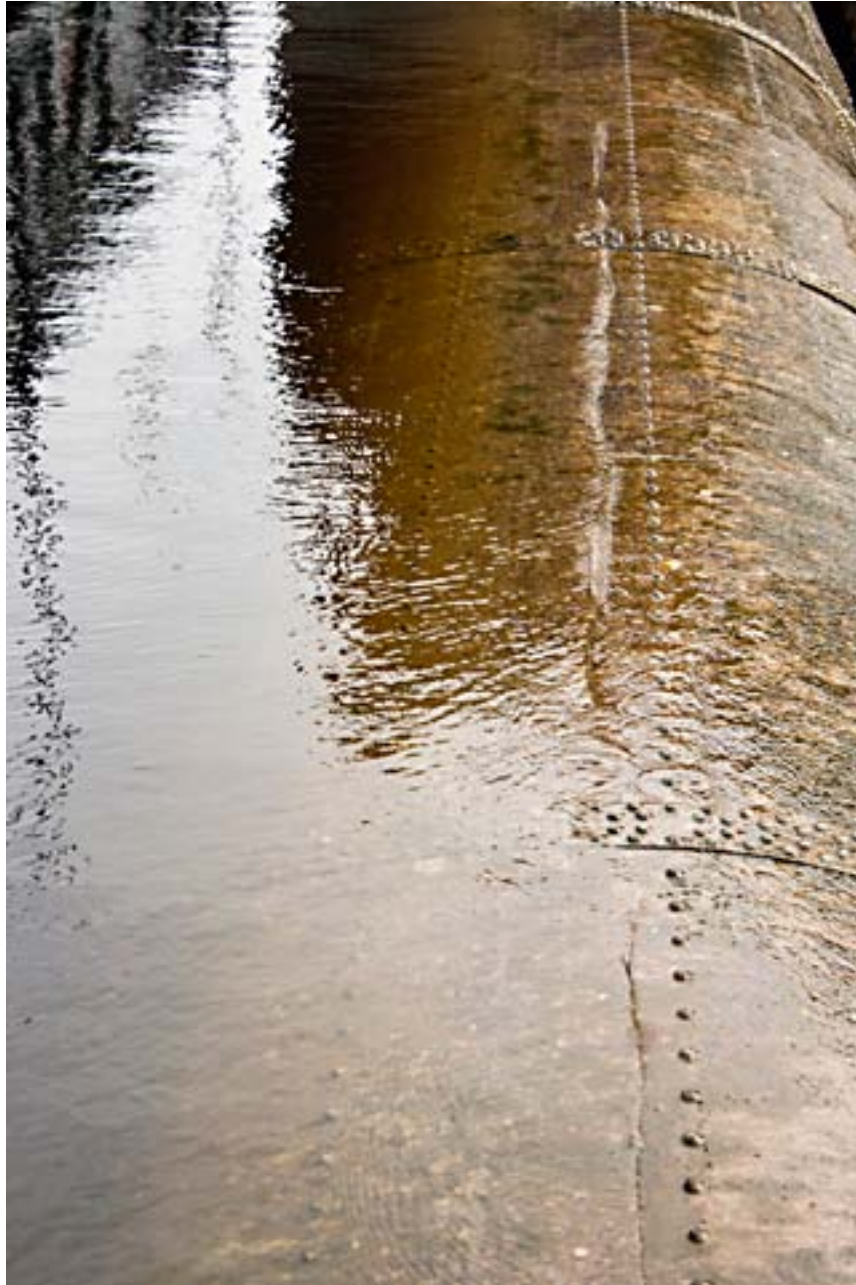
August Waters 1.