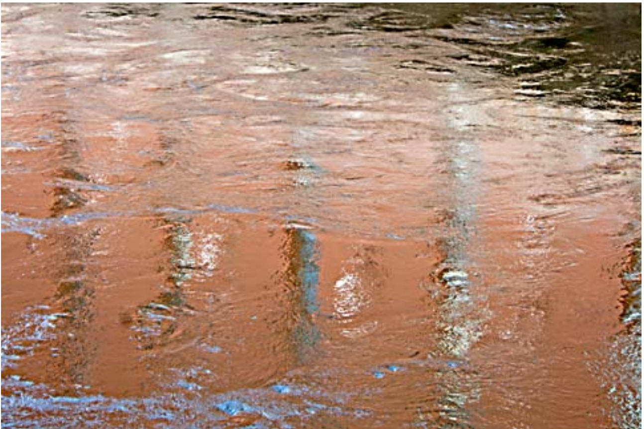
Reflections of the Red House