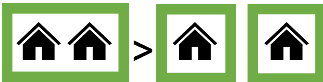
Kuvio 3: Pienkoti Aisan ja Pienkoti Akselin synergiaetu