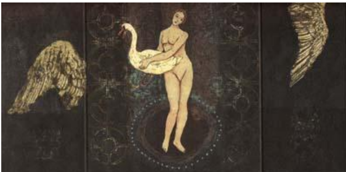
Kuva 1 Leda (Kirsi Neuvonen 1997)

itsenäisiä taideteoksia. (Simpanen 2008.) Kuvassa 1 on nähtävissä Neuvosen teos Leda (koko 20 x 10/20/10cm) vuodelta 1997. Teos kuuluu Jumalaisia naisia näyttelyteemaan. Vuonna 1997 Neuvonen kävi läpi taidehistorian naishahmoja ja liitti Ledan kanssa kuvaan Zeuksen , joutsenen hahmossa. Leda on lentokentän laskeutumisvalopisteiden muodostamassa ympyrässä, ikään kuin taivaantähtien ja universumin kehässä, keskipisteessä. Sivuosissa on siivet katkaistuna tai osapiirroksina, tavallaan reunahuomautuksina. Teoksen siniset kehykset ovat tukemassa värimaailmaa. Sivuosien kansissa on sama pyöreä keho ovenripana kuin Ledan jaloissa. Tässä teoksessa tekniikkana on käytetty etsausta, akvatintaa ja kopiosyövytystä. (Neuvonen 2010.)