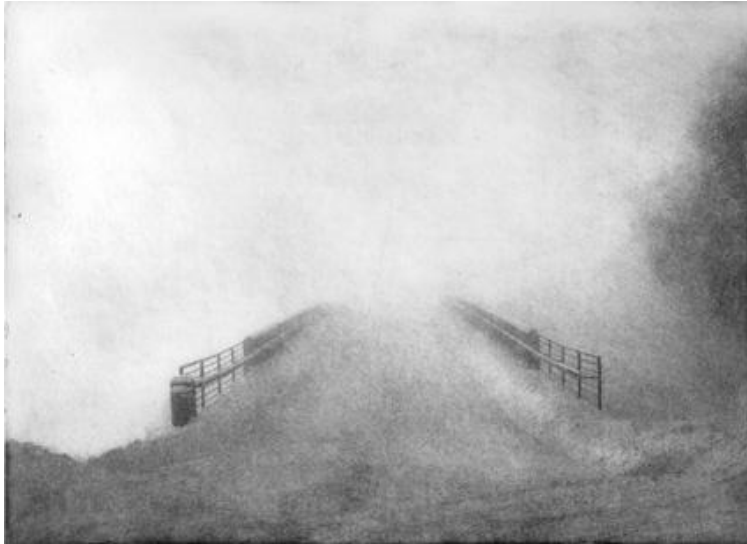
Kuva 3 Hetki (Hanne Kärki 2010)