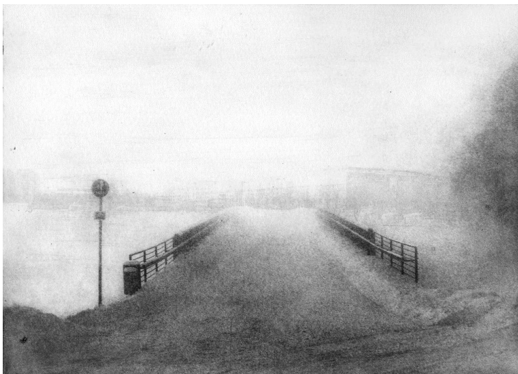
Kuva 4 Kohtaaminen 2010 (Hanne Kärki 2010).