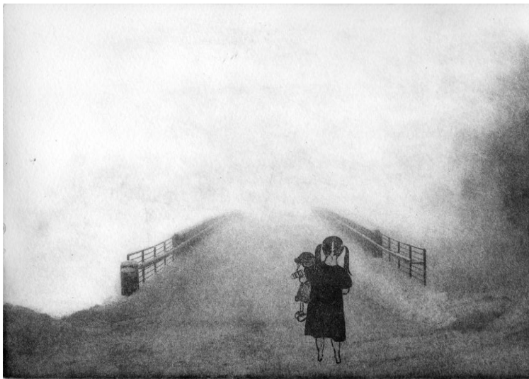
Kuva 4 Kysymysten äärellä (Hanne Kärki 2010).