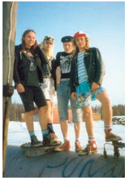
Himanesin teini-meininkiä vuosilta 1992 ja 1995.

huomasit, että ihmisethän ilmeisesti muistavat meidät ja oikeasti haluavat, että soittamme. Ihan hillitön meininki oli ja ei jäänyt mitään epäselvyyttä, etteikö kannattaisi jatkaa tätä.