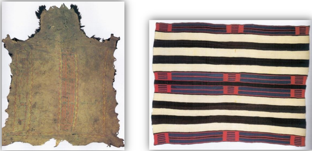
KUVIO 3 Vasemmalla Lakota-naisen biisoni-viitta maalein koristeltuna. Oikealla Navajo-intiaanien päällikköviitta. (Hankaniemi & Varjola 1995, 102, 142)