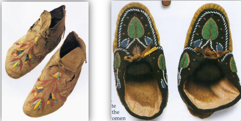
KUVIO 2 Mokkasiineja (Hankaniemi & Varjola 1995, 153; Murdoch 2005, 13)