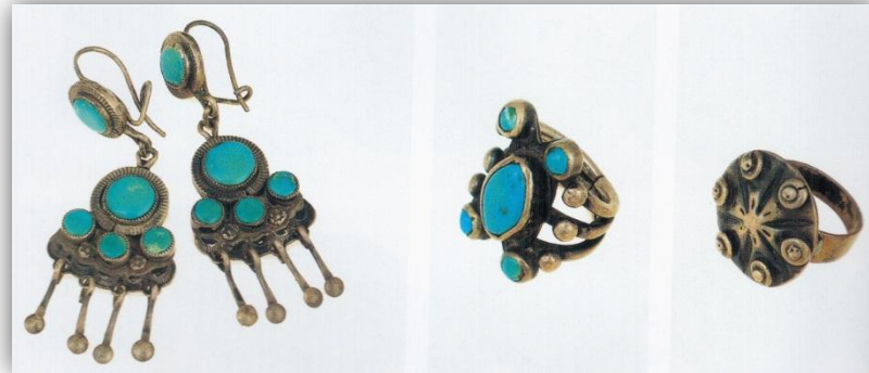
KUVIO 13 Turkoosein koristeltuja metallikoruja. (Hankaniemi & Varjola 1995, 116)

Navajo-intiaanit olivat tunnettuja hopea- ja turkoosikorujen valmistajia, vaikka he oppivat taidon vasta 1800-luvulla meksikolaisilta (KUVIO 14). Hopeasepän ammatti on kulkenut suvuissa eikä taitoa ole opetettu kenelle tahansa. Koruihin tarvittava metalli saatiin hopea-rahoista. Tärkeimpiä koruja olivat hopeavyöt, jousiampujan ketoh-rannesuojukset, rannerenkaat, sormukset ja kaulanauhat. Yksinkertaiset hopearenkaat kuuluivat niin miesten kuin naistenkin koruihin, mutta turkoosien suosion myötä korvariipuksista tuli entistä tärkeämpi naisten koriste. (Bedinger 1973, 16, 23.)