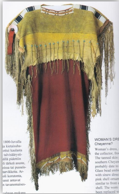
KUVIO 6 Intiaaninaisen puku. (Hankaniemi & Varjola 1995, 146)