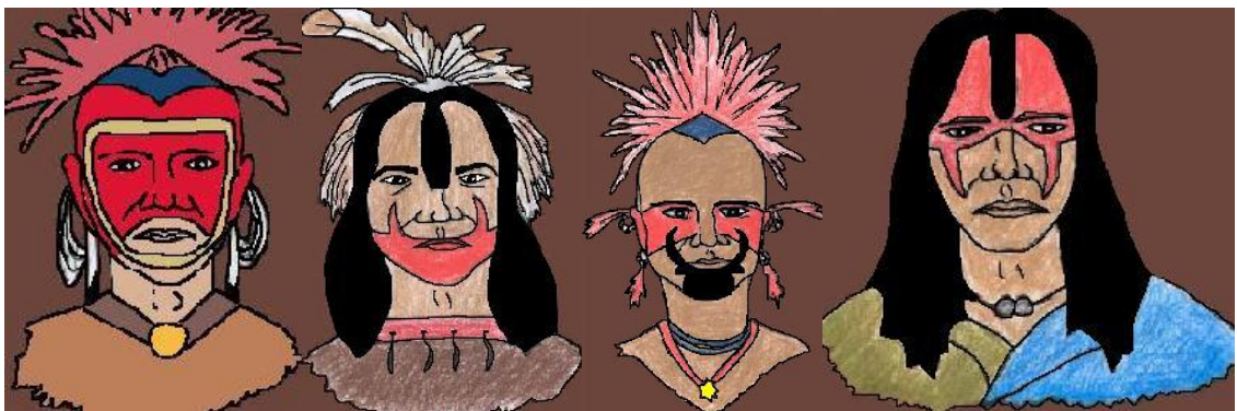
KUVIO 14 Iowa-, Mustajalka-, Pawnee- ja Teton-heimon soturi sotamaaleissaan. (Niemi & Saarenpää 2005.)

Koska intiaanit elivät laajalla mantereella melko pienissä ryhmissä ja vielä hyvin erilaisissa olosuhteissa, intiaanikulttuurit olivat hyvin poikkeavia symbolismiltaan. Erilaisia vartalo-, kasvo ja hiusmaalauksia käytettiin yleisesti intiaaniheimoissa hyödyntäen kunkin alueen symbolisia värejä. Maalaukset liitetään usein sotavalmisteluihin, josta nimi ”sotamaalaus”. Hevonen ja kilpi koristeltiin samoin kuvioin kuin sotilaan iho. Maaleja käytettiin myös muissa yhteyksissä, sillä se suojasi esimerkiksi auringolta ja tuulelta sekä hyönteisiltä. Kuvioilla ja symboleilla kuvattiin erilaisia tunnetiloja ja ne liittyivät usein myös seremonioihin. Tatuoinnit olivat yleisiä peittäen joskus koko ruumiin. Punainen oli vartalonmaalauksissa ja tatuoinneissa suosituin väri. Päänahkoja ottaneet soturit maalasivat kotiinpaluun kunniaksi kasvonsa mustiksi. Mustajalkojen miehet maalasivat kasvoihinsa raitoja, ympyröitä ja pisteitä. (Tunturisusi, 2010; Hintsanen 2000b.) (KUVIO 14)