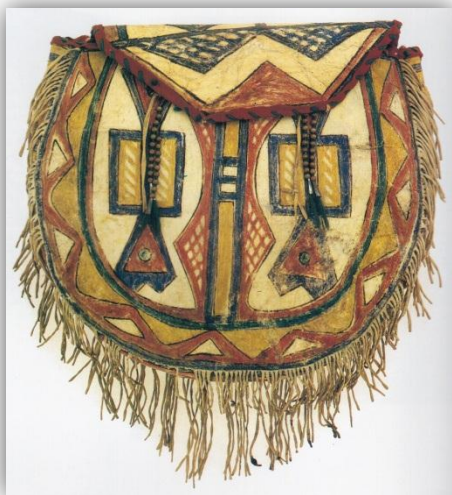
KUVIO 15 Blackfoot-intiaanien kolmesta palasta ja jännelangoilla ommeltu laukku. (Hankaniemi & Varjola 1995, 168.)

Tasanko-intiaanit edellyttivät liikkuvan elämäntapansa vuoksi omaisuudeltaan käytännöllisyyttä. Jokaiselle esineelle piti olla oma tietty paikkansa, minkä vuoksi laukut olivat suosittuja heimojen keskuudessa. Tärkeimpiä olivat parfleche't eli kirjekuorimaiset, nuijitusta raakanahasta tehdyt laukut, joissa säilytettiin ruokatarvikkeita. Myös vaatteille, ompelutarvikkeille sekä tipin rakennukseen tarvittaville tavaroille oli omat laukkunsa. Parkitusta nahasta valmistettiin satulalaukkuja. Naisten laukuissa ei ollut hapsuja, mutta ne oli usein koristeltu helmillä tai piikkisian piikeillä. Myös pyhille esineille oli omat laukkunsa. (Hankaniemi & Varjola 1995, 166.) (KUVIO 15)