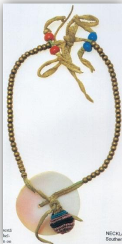
KUVIO 12 Messinki- ja lasihelmistä sommiteltu kaulakoru. (Hankaniemi, Varjola 1995, 163)

Monet miesten koruiksi luokitellut esineet kuten harjaspäähineet tai karhunkynsi-kaulakorut ovat alun perin olleet arvomerkkejä, soturiseuratuksia tai uskonnollisia esineitä. Vaatteiden ja korujen arvo tuli olla suhteessa henkilön saavutuksiin. Ylipukeutuminen herätti paheksuntaa, samoin huolimattomuus, jos oli kysymys arvohenkilöstä. Koruissa käytettyjä materiaaleja olivat muun muassa hopea, messinki, nahka, turkis ja erilaiset korukivet kuten turkoosi. (Hankaniemi & Varjola 1995, 160.) (KUVIO 12)