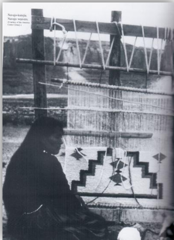
KUVIO 9 Navajo-kutoja. (Hankaniemi & Varjola, 1995, 100)

Pohjois-Amerikan intiaanit oppivat kudontataidon Väli-Amerikan vanhoilta kulttuureilta. Ensimmäiset tekstiilit kudottiin sormin hampusta, jukka-kuidusta, sulista ja turkissuikaleista. 600-luvulla Pohjois-Amerikassa ryhdyttiin kutomaan puuvillasta ja vuoden 1000 jälkeen otettiin käyttöön pystykangaspuut. Kangaspuut ovat yksinkertainen pystykehä, jossa voidaan kutoa vain siihen pingotettujen loimien kokoinen kappale. Kudonta aloitetaan alhaalta, toisinaan kudotaan ensin toinenkin reuna kääntämällä kangaspuut ylösalaisin ja päätetään työ keskelle. Aluksi kutomisessa käytettiin luonnonvaraista puuvillaa, mutta vähitellen siirryttiin viljeltyyn materiaaliin. Eurooppalaiset toivat tullessaan 1500-luvulla lampaista ja villanmuokkaustaidon sekä ensimmäiset teolliset kankaat ja indigo-värin. Eri-tyyppisiä taitavia kutojia olivat navajot, jotka kutoivat niin tiiviin huovan, että se oli lähes vedenpitävä. (Hankaniemi & Varjola 1995, 94, 100.) (KUVIO 9)