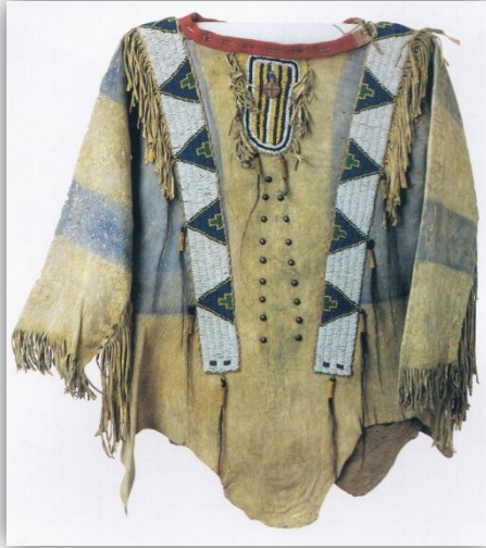
KUVIO 4 Ute-miehen ponchomainen paita parkitusta nahasta. (Hankaniemi & Varjola 1995, 147)

Pohjoisimman alueen asukkaiden vaatteet olivat kevyitä, mutta niiden eristävyys oli erinomaista. Pohjoisen intiaanit hyödynsivät vaatteissaan usein hyljettä ja osa vaatteista valmistettiin hylkeiden suolista. Anorakki-malliset takit olivat ilmatiiviitä ja jättivät eristävän ilmakerroksen ihoa vasten. Jos käyttäjälle tuli hiki, hän saattoi tuulettaa takkia siten, että kaula-aukosta lämmin ilma pääsi ulos ja löysästä alaosasta tuli kylmää ilmaa tilalle. Kajakissa takki saatettiin sitoa kiinni siten, että istuinosa pysyi kuivana. (Murdoch 2005, 61.) (KUVIO 5)