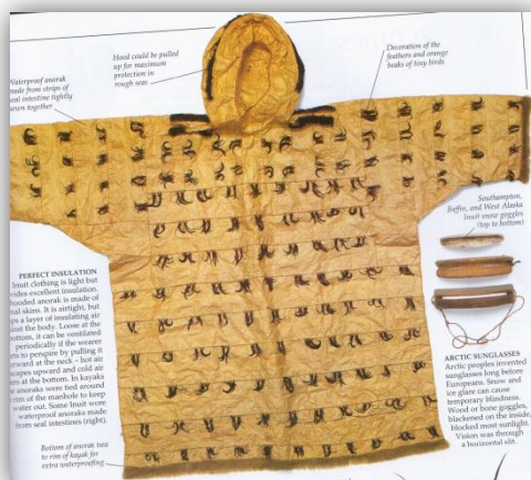
KUVIO 5 Inuiittien hylkeen suolista valmistettu vedenkestävä anorakki. (Murdoch 2005, 61)

Pohjoisimman alueen asukkaiden vaatteet olivat kevyitä, mutta niiden eristävyys oli erinomaista. Pohjoisen intiaanit hyödynsivät vaatteissaan usein hyljettä ja osa vaatteista valmistettiin hylkeiden suolista. Anorakki-malliset takit olivat ilmatiiviitä ja jättivät eristävän ilmakerroksen ihoa vasten. Jos käyttäjälle tuli hiki, hän saattoi tuulettaa takkia siten, että kaula-aukosta lämmin ilma pääsi ulos ja löysästä alaosasta tuli kylmää ilmaa tilalle. Kajakissa takki saatettiin sitoa kiinni siten, että istuinosa pysyi kuivana. (Murdoch 2005, 61.) (KUVIO 5)