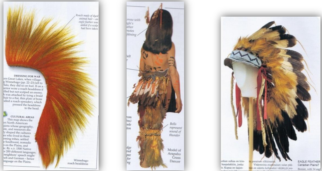
KUVIO 7 Intiaaneille tyypillisiä rituaalisia koristeita. (Murdoch 2005, 9, 29; Hankaniemi & Varjola 1995, 157)