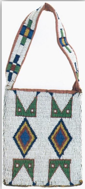
KUVIO 11 Lakota-intiaanien lasihelmillä kirjailtu nahkalaukku. (Hankaniemi & Varjola 1995, 172)

Lasihelmet ommeltiin useimmiten joko niin sanotuilla laiskanpistoilla tai applikointipistoilla. Laiskanpistoin ommellessa lankaan pujotetaan useita helmiä ennen kuin se kiinnitetään alustaan pistolla. Laiskanpistoin ommellut kuviot ovat lähes aina geometrisia. Applikointipistoilla ommellessa helmet pujotetaan yhteen lankaan, joka kiinnitetään alustaan toisella langalla yli ommellen. Tuloksena on litteä työn jälki. Kuviot olivat usein kasviaiheisia (KUVIO 11). Kumpaakin menetelmää on käytetty kaikilla kulttuurialueilla. Lasihelmet olivat 1920-luvulle saakka pääosin venetsialaista alkuperää. Tämän jälkeen väriltään kirkkaammat ja kooltaan säännöllisemmät helmet syrjäyttivät ne. (Hankaniemi & Varjola 1995, 140, Lyford 1979, 60–62.)