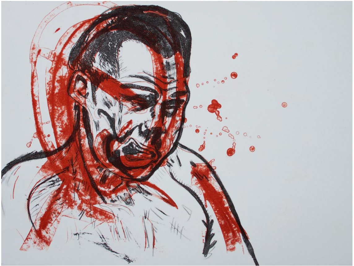
Kuva 2. Entertain Me, Richie 2016, litografia paperille, 42 cm x 55 cm.

ruhjottuja kasvoja (Kuva 2), se saa minut miettimään, miksi teen tätä, mitä tämä antaa minulle tai kenellekään?