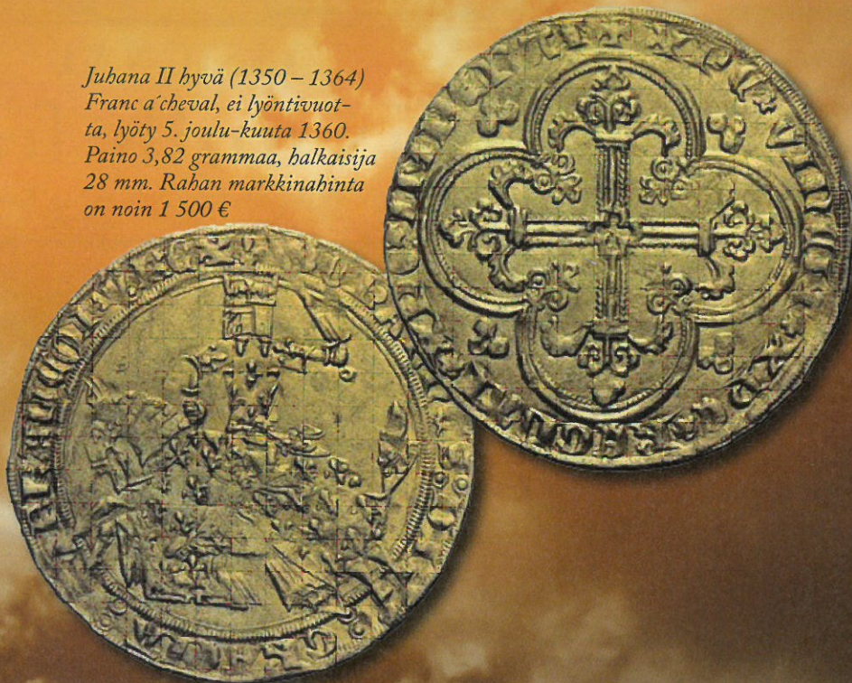
Juhana II hyvä (1350 – 1364) Franc à cheval, ei lyöntivuotta, lyöty 5. joulukuuta 1360. Paino 3,82 grammaa, halkaisija 28 mm. Rahan markkinahinta on noin 1 500 €

rahapajan tunnut A sekä kehäkirjoitus HENRICVS. III. D. G. FRAN. ET. POL. REX. Taustapuolella on kuninkaan monogrammi H sekä kehäkirjoitus + SIT. NOMEN. DOMINI. BENEDICTVM 1575. Hopeinen frangi pysyi tuotannossa vuoteen 1641 asti, vaikkakin Henrik III:n kokofranga leikeltiin vajentamismielessä niin paljon, että niiden tuotanto keskeytettiin vuonna 1586.