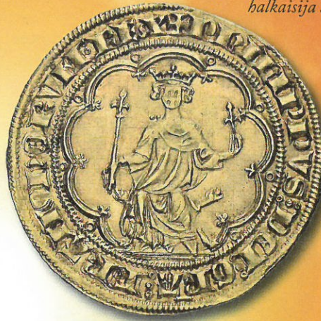
Kuva 1. Philip IV kaunis (1285 – 1314) Denier d'or à la masse, ei lyöntivuotta, lyöty 10. tammikuuta 1296. Paino 6,86 grammaa, halkaisija 31 mm. Rahan markkinahinta on noin 13 000 €

Ensimmäinen frangiksi kutsuttu raha lyötiin Ranskassa 4. joulukuuta 1360 juhlistamaan Ranskan kuningas Juhana II hyvän paluuta Poitiers'in taistelussa 19. syyskuuta 1356 briteille koetun tappion jälkeen alkaneesta vankeudesta. Rahan etupuolelle on kuvattu kuningas sotaisasti haarniskoituna laukkaamassa ratsullaan miekka kohotettuna. Sotaisan ratsastajan lisäksi kehäkirjoituksena on teksti IOHANNES:DEI:GRACIA:FRANCORVM:REX. Raha sai nimen franc à cheval eli ratsufrangi. Raha lyötiin puhtaasta kullasta ja se vastasi ilmeisesti sattumalta keskiaikaista livre tournois (Tourainen punta) -kirjanpitoyksikköä. Näin ollen tämä uusi