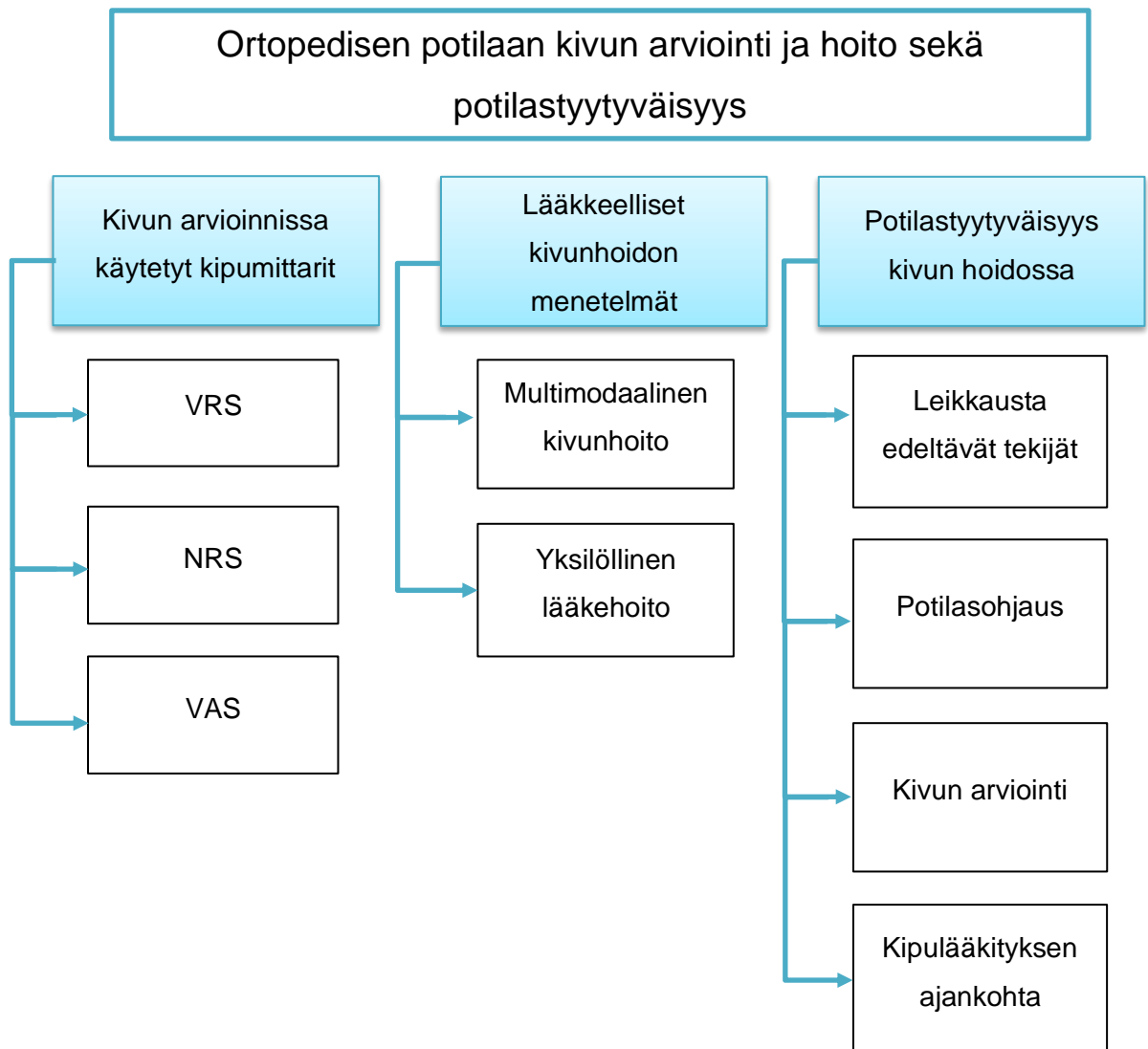
Kuvio 2. Aineiston luokittelu ylä- ja alaluokkiin

ja niiden välisiä suhteita käsiteltiin kriittisesti (Kangasniemi ym. 2013: 291–301). Sisällönanalyysin viimeisessä vaiheessa tuloksien ja raportoinnin luotettavuutta sekä eettisyyttä arvioitiin (Kankkunen – Vehviläinen-Julkunen 2018: 166).