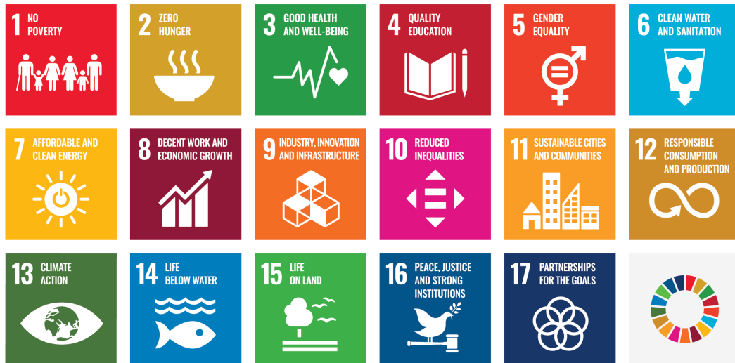
Kuvio 2. The Sustainable Development Goals poster (United Nations 2019)

Kestävä kehitys tarkoittaa yhteiskunnallista muutosta, jonka päämääränä on ihmisten, ympäristön ja talouden kannalta kestävämpi tulevaisuus. Kun mietimme omia valintojamme, ja sitä ovatko ne kestäviä, me voimme kysyä itseltämme voimmeko tehdä näin uudestaan ja uudestaan, ikuisesti. Meidän pitää ymmärtää maapallomme rajallisuus. Kestävää kehitystä ajatellessa on pidettävä mielessä kolme eri pilaria: Ekologinen, taloudellinen ja sosiaalinen kestävyys. (UNICEF Norja 2019.)