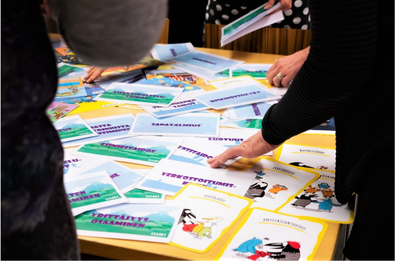
KUVA 1. Vahvuuksia ja osaamista voidaan tunnistaa esimerkiksi erilaisten korttien avulla

arvoilla sekä voimavaroilla ja resursseilla [8] [7]. Näitä tekijöitä monipuolisesti jäsentämällä luodaan pohja osaamidentiteetin kehittymiselle, opintojen ja uran suunnittelulle sekä opiskelijan mahdollisuudelle toimia voimakkehällään, jossa sekä hyvinvointi, innostus että osaaminen ovat korkealla [9].