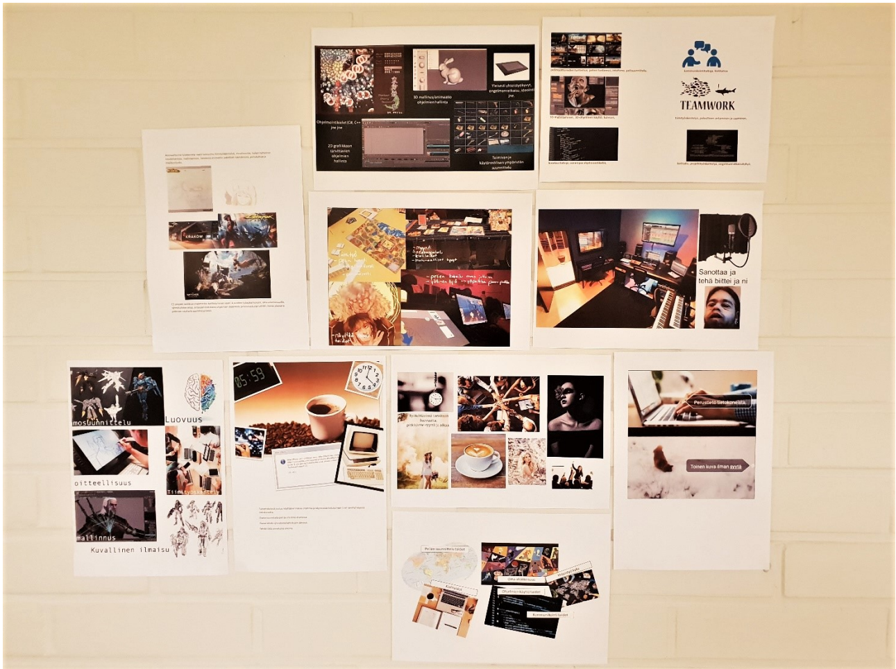
KUVA 4. Unelmakartta auttaa hahmottamaan omia tulevaisuuden suunnitelmia sekä asettamaan tavoitteita osaamisen kehittämiseksi

Ennakointitiedon pohjalta tulevaisuuden työelämässä korostuvat muun muassa projektimaiset ja yrittäjämäiset työskentelytavat ja työtä tehdään entistä enemmän erilaisissa tiimeissä ja monialaisissa verkostoissa erilaisia teknologioita hyödyntäen. Nämä uudenlaiset työskentelyn tavat vaativat tekijältään myös esimerkiksi taitoa ja valmiuksia luovaan ongelmanratkaisuun, kriittiseen ajatteluun, jatkuvaan oppimiseen ja yhteistyöhön sekä itsetuntemusta. (mm. 116 .)