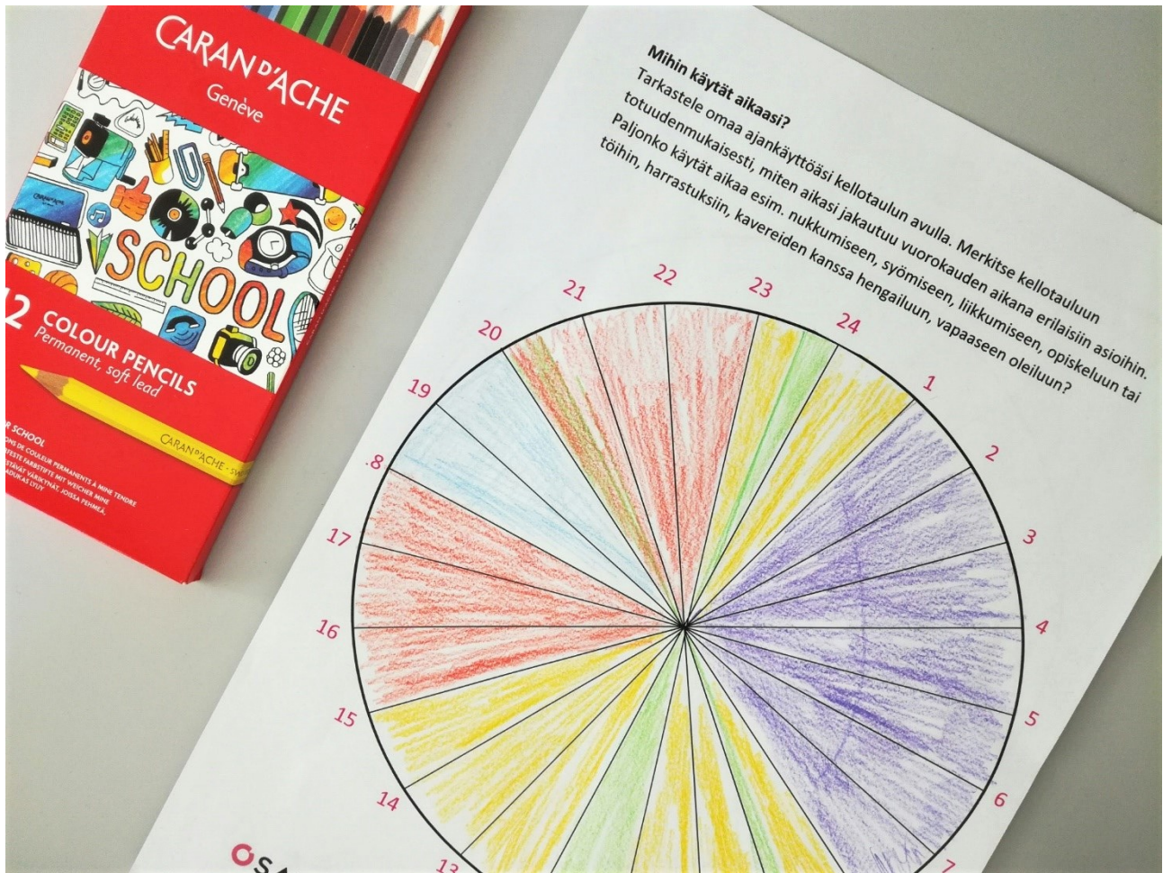
KUVA 2. Ajankäyttökello auttaa hahmottamaan omaa arkea ja hyvinvointiin vaikuttavia tekijöitä

Toisena harjoituksena työpajoissa käytettiin voimavaravaakaharjoitusta, joka pohjautuu työn imun sekä työn vaatimusten ja voimavarojen teorioihin [12] . Voimavaravaakaa'n avulla tarkasteltiin opiskeltavan alan tyypillisiä työn voimavaroja sekä vaatimuksia. Opiskelijoiden kanssa harjoitus toteutettiin pienryhmissä, joihin osallistuivat myös alan ammatinopettajat. Näin keskusteluun tuotiin mukaan myös opettajan näkökulmaa sekä tietoa ja huomioita alalle tyypillisistä muun muassa ergonomiaan tai työaikoihin liittyvistä kuormitustekijöistä. Toisaalta harjoituksen kautta päästiin keskustelemaan myös työssä merkityksellisistä hyvinvointia ja työn imua tuottavista tekijöistä, kuten työyhteisön merkityksestä. Myös omien vahvuuksien hyödyntäminen on merkittävä voimavara ja keskeinen hyvinvointia ja työn imua edistävä tekijä [13] .