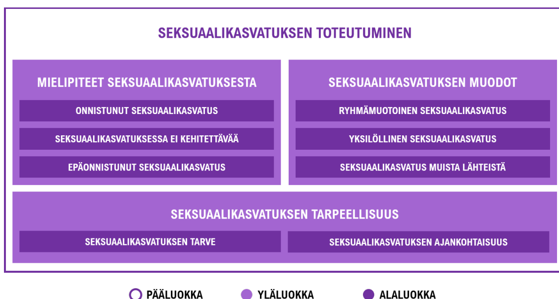
KUVIO 2. Seksuaalikasvatuksen toteutuminen

Tutkimustuloksissa tuli esiin kolme pääluokkaa, joista ensimmäinen oli seksuaalikasvatuksen toteutuminen. Seksuaalikasvatuksen toteutuminen muodostuu kolmesta yläluokasta. Kuvio (KUVIO 2) havainnollistaa luokkien muodostumisen.