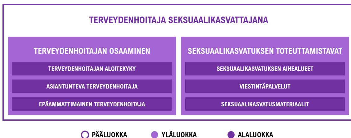
KUVIO 3. Terveydenhoitaja seksuaalikasvattajana

Toisena pääluokkana oli terveydenhoitaja seksuaalikasvattajana, joka muodostui kahdesta yläluokasta. Kuvio (KUVIO 3) havainnollistaa luokkien muodostumisen.