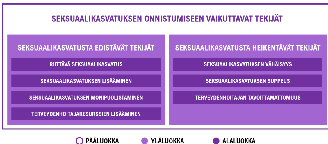
KUVIO 4. Seksuaalikasvatuksen onnistumiseen vaikuttavat tekijät

Kolmas pääluokka oli seksuaalikasvatuksen onnistumiseen vaikuttavat tekijät, joka muodostuu kahdesta yläluokasta. Kuvio (KUVIO 4) havainnollistaa luokkien muodostumisen.