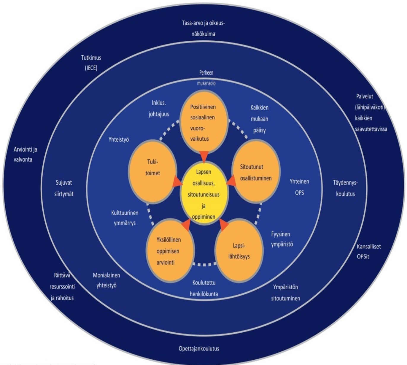
Inklusiivisen varhaiskasvatuksen ekosysteeminen malli

KUVIO 2. Inklusiivisen varhaiskasvatuksen malli (Inklusiivisen varhaiskasvatuksen malli 2018).