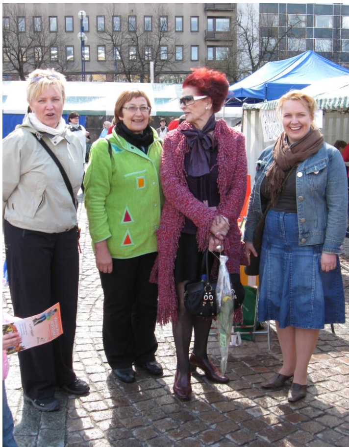
Tapaaminen Lahden torilla