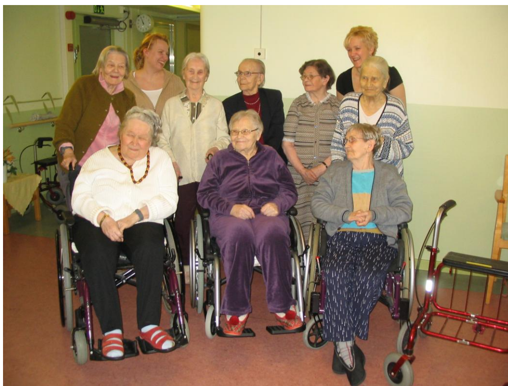
Kuvassa me ja yksi ikäihmisryhmistämme.

Olemme kokeneet, että työ ikäihmisten parissa on kokemuksena rikastuttanut omaa ajattelutapaamme ja yleissivistystämme sekä virkistänyt ja toiminut eräänlaisena terapiana myös meille itsellemme. Työ lapsiryhmien ohjaajana on hektistä, ja vastuu lapsista vaatii opettajan kokonaisvaltaista läsnäoloa, kun taas ikäihmisten parissa voimme nauttia kiireettömyydestä ja rauhallisesta ilmapiiristä. Vanhusten parissa työskentely on antanut meille eväitä myös työhömmme lasten parissa. Koemme olevamme eräänlaista saronasukupolvea, jonka tehtävänä on siirtää edellisen sukupolven historiaa ja kansanperinnettä edelleen seuraavalle sukupolvelle. Vaikka lasten antama palaute on usein suoraa, on ikäihmisiltä saamamme myönteinen palaute ollut moninkertaista ja tuntunut vielä palkitsevammalta. Tämän ikäpolven vanhukset ovat kokeneet paljon, ja he osoittavat kiitollisuuttaan sydämestään. Osaammekohan itse olla vanhuusiässä yhtä kiitollisia?