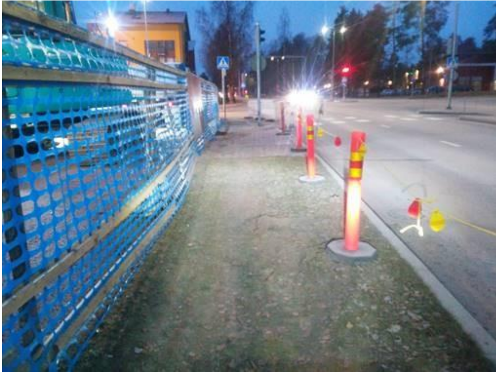
Kuva 5. Kerrostalotyömaan liikennejärjestelyt. (Tomi Lapinlampi, Lappeenrannan kaupungin pyöräilyn kehitystyöryhmä 2019)

Kauempana keskustasta sijaitsevien vesivuotojen ym. pienempien töiden valvonta on hoidettava puhelimen välityksellä urakoitsijan kanssa, sekä tarvittaessa pyydettyä dokumentoimaan kohde valokuvaamalla. Kahden viikon välein järjestettävässä kunnossapitopalaverissa sovitaan tarvittaessa kauempana olevien lupakohteiden valvonnasta, joista tiemestarit raportoivat katuisännöitsijälle.