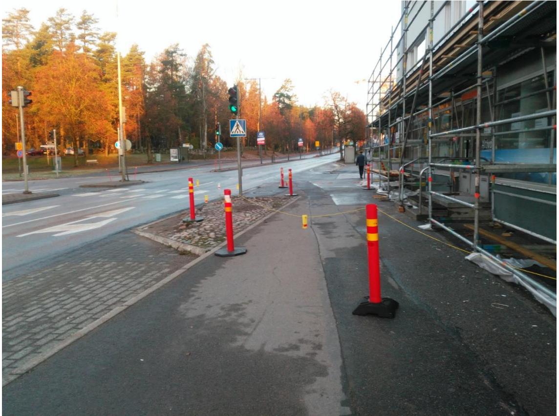
Kuva 2. Kevyt liikenne ohjattu ajoradalle.

Vanhassa hinnoittelussa esimerkiksi luvattomista töistä, puutteellisista liikennejärjestelyistä ja lupa- tai vuokra-ajan ylityksistä tullut tarkastusmaksu oli niin pieni, että urakoitsijoilla ei ollut mitään pelkoa siitä, että heille tulisi lisäkustannuksia. Perushintoja ei korotettu kuin 10 – 20 %, mutta uudet luvattomasta työstä tulevat maksut hinnoiteltiin korkeammiksi, koska ainoa tehokas keino kitkeä nämä jatkuvasti toistuvat ja turhaa lisätyötä valvontaan aiheuttavat toimet ovat tuntuvat maksut. Myös puutteellisesti täytettyjen lupahakemusten hyväksyminen on aiheuttanut turhaa työtä. Jos puutteellisiin hakemuksiin pyydetään täydennykset, vältetään esimerkiksi kuvan 3. kaltaiset vaaralliset ratkaisut.