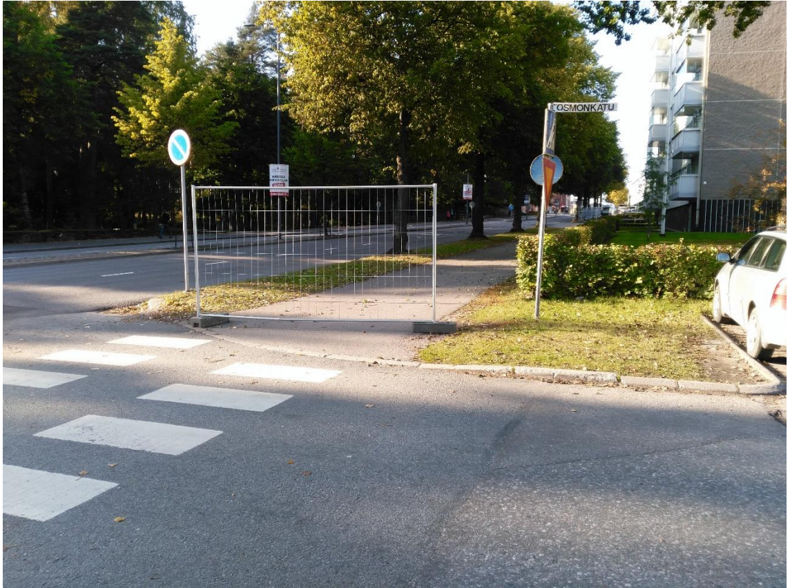
Kuva 3. Kevyenliikenteenväylä katkaistu ilman liikennejärjestelyjä.

Maksutaulukkoon lisättiin luvattomasta liikenteen katkaisusta ja luvattomasta säilytyksestä katualueella tulevat maksut, joita ei aiemmin ollut käytössä. Aiemmin näitä ei eritelty mitenkään vaan liikenteen katkaisemisesta luvatta tuli sama tarkastusmaksu kuin luvattomasta työskentelystä, mutta liikenteen katkaiseminen on paljon suurempi rike, joten maksunkin on oltava tuntuvampi. Liikenteen katkaisemisesta on lupaohjeissakin maininta, että siitä on ilmoitettava pelastuslaitokselle, sekä mahdollisesti poliisille kaksi päivää ennen katkaisemista. Jos pelastuslaitoksella ei ole tietoa asiasta, voi se hälytystilanteissa aiheuttaa kriittisiä esteitä tai myöhästymisiä. (Lappeenranta, Kadut ja ympäristö, Katujen ja puistojen käytön ohjeet ja ehdot.)