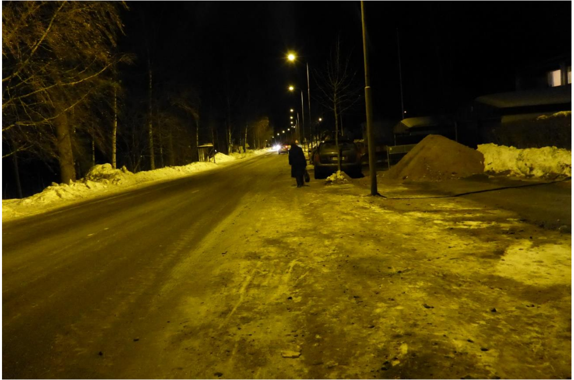
Kuva 1. Vaarallinen talvinen vesijohtotyömaa.

Vanhoja maksuja päädyttiin korottamaan myös siksi, että pelkästään viime kesän ja syksyn aikana törmättiin lukuisiin puutteellisiin ja vaarallisesti toteutettuihin väliaikaisiin liikennejärjestelyihin, joissa ei otettu varsinkaan kevyen liikenteen esteettömyyttä ja kiertoteitä huomioon lainkaan. Maksutaulukkoon lisättiin kohta, jossa tarkastusmaksu perustuu turvallisuushuomautukseen tai puutteellisiin väliaikaisiin liikennejärjestelyihin. Näissä tapauksissa ensimmäisestä huomautuksesta ei laskuteta, toisesta laskutetaan 300 € ja kolmannesta huomautuksesta 600 €. Jos kolmas huomautus ei tehoa tai laskuja jää maksamatta, kaupunki kieltää kyseiseltä toimijalta yleisillä alueilla työskentelyn toistaiseksi. Kuvassa 2. on esimerkki vaarallisesta kerrostalon julkisivu-työmaasta, jossa kevyen liikenteen turvallisuutta ei ole huomioitu. Kevyt liikenne on ohjattu suoraan ajoradalle ilman minkäänlaista suojaa.