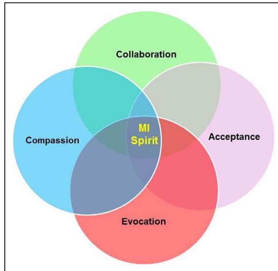
Kuva 1. The spirit of motivational interviewing (Roberto Benzo, 2013)

Empatiaa osoittamalla ammattilainen luo asiakkaalle tunteen, että hänen asiastaan ollaan aidosti ja oikeasti kiinnostuneita. Hyviä keinoja luoda tämä tunne on katsekontaktin säilyttäminen, tarkkaavainen kuuntelu sekä tasaisin väliajoin äänellä hyväksyvästi yksinkertaisimmillaan sanoen väliin ”mmm” tai muuta vastaavaa. Asiakkaan itseluottamusta ja hänen kykyjään vahvistessa tärkeää on tunnistaa positiiviset piirteet ja pienetkin edistymisen askeleet asiakkaan tilassa ja tuoda niitä esille negatiivisten piirteiden sijaan. Asiakkaan alkaessa prosessoida näitä positiivisia piirteitä enenevässä määrin, voi ammattilainen aloittaa nykyisen ja tavoiteltavan tilanteen välillä olevan ristiriidan luomisen . Ammattilainen alkaa siis vahvistaa asiakkaan omaa muutospuhetta ja auttaa asiakasta tuomaan esille menneen ja tulevan välillä olevaa ristiriitaa motivoiden asiakasta elämäntapamuutokseen yhä enemmän. (Järvinen 2014.)