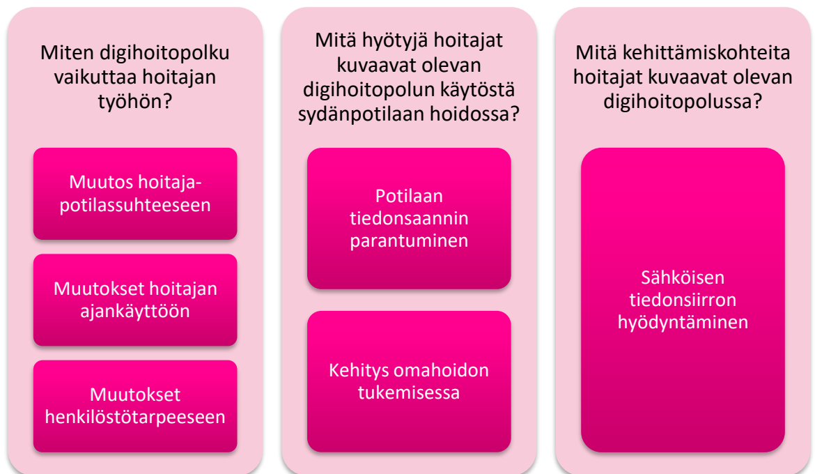
KUVIO 2. Tutkimuskysymykset ja niihin vastaavat yläluokat.

Tutkimuksemme tärkeimmät tulokset kuvataan kuviossa 2. Kuviossa on havainnollistettu tulosten eli yläluokkien vastaavuus tutkimuskysymyksiin. Tässä pääluvussa tutkimustulokset on kirjoitettu niin, että yläluokan nimi on alaluvun otsikkona ja tummennettuna on alaluokat, joista yläluokka muodostui.