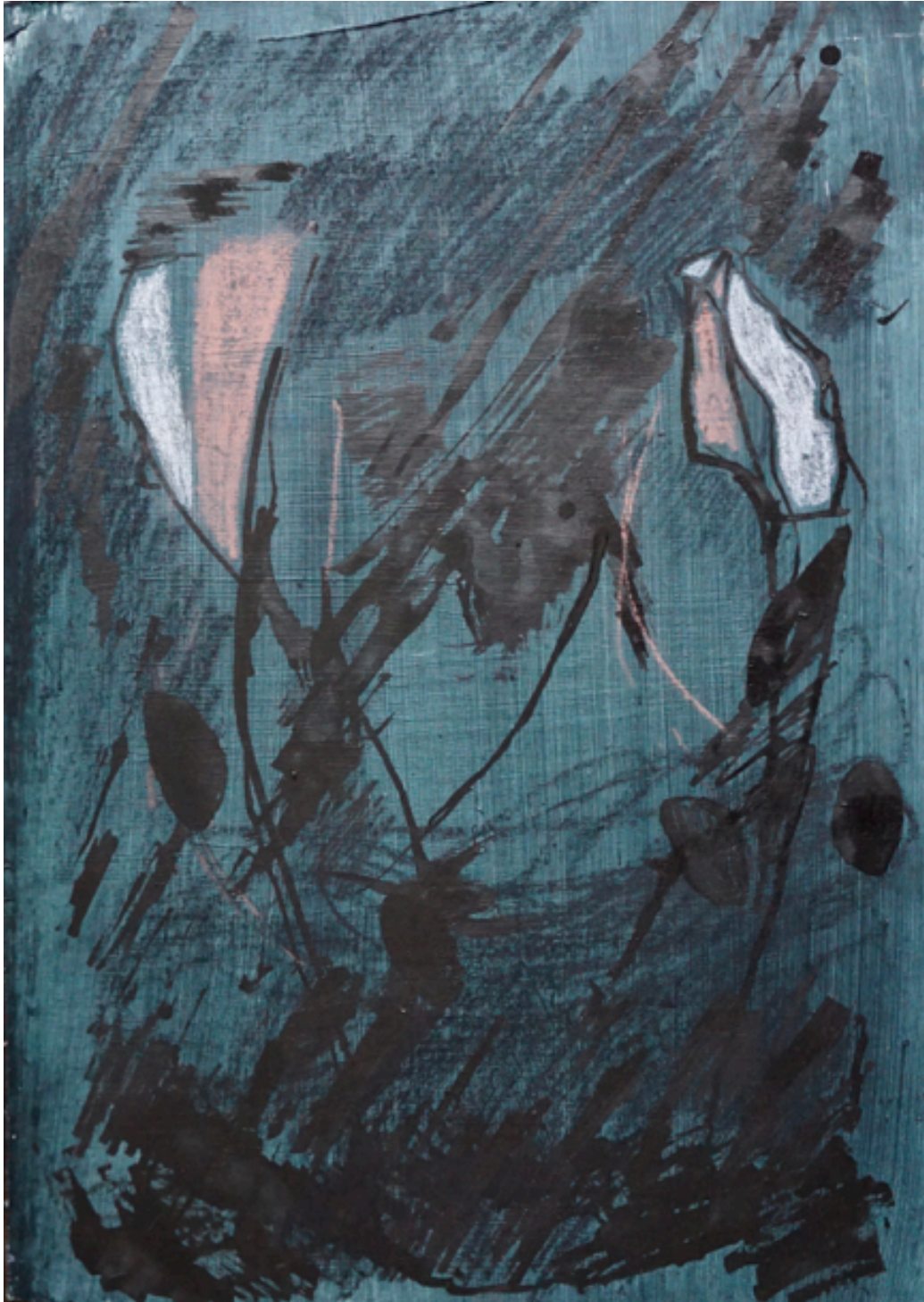
"Pitkän tauon jälkeen ensimmäisenä syntyy paskaa, ja se on ihan ok", osa 4