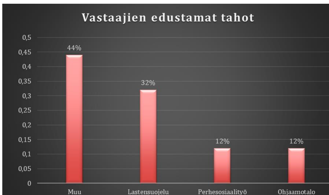
taulukko 1 Vastanneiden määrät

kyselyni kysymykset voi karkeasti jakaa kahteen osaan. On kysymyksiä, joilla pyritään selvittämään, onko kyselyyn vastanneiden asiakaskunnassa ylipäänsä vammaisia nuoria tai heidän perheitään ja ovatko työntekijät koskaan lähettäneet tai edes pohtineet vammaisen nuoren tai hänen perheensä lähettämistä turvatalopalveluiden piiriin. Sen lisäksi on kysymyksiä, joilla selvitetään kuinka paljon vastaajilla itsellään on tietoa turvatalopalveluista, mistä he toivovat lisätietoa ja millä tavalla. Vaikka vastaajamäärä olisikin voinut olla suurempi on vastaajia mielestäni riittävästi siihen, että vastauksia näihin kysymyksiin voidaan selvittää ja ratkoa kyselyn vastausten perusteella.