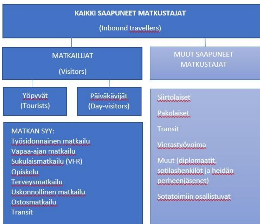
KAAVIO 2. Matkustajien jaottelu. (Verhelä 2014, 24 mukaan UNWTO, muokattu).

”Matkailijalla (tourist, overnight visitor) tarkoitetaan yöpyvää matkailijaa, joka viettää vähintään yhden yön matkan kohteessa joko maksullisessa tai maksuttomassa majoituksessa. Kansainvälinen matkailija on matkailija, joka viettää ainakin yhden yön matkan kohteena olevassa maassa. Kotimaanmatkailija on matkailija, joka viettää ainakin yhden yön matkan kohteena olevassa paikassa. Matkailija, joka ei yövy yhtään kertaan matkansa aikana on päivämattkailija (päiväkävijä).” (UNWTO, 2012.)