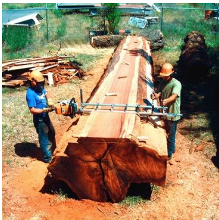
KUVA 3. Granberg Alaskan MK-IV Portable Chainsaw Mill – 48" ( https://mikeschainsawshop.co.nz/product/48-granberg-alaskan-mkiii-chainsaw-mill/ )

Toinen mahdollisuus olisi ottaa mukaan isompi käsisaha, jolloin voitaisiin käyttää samaa sahausmetodia intialaisen työvoiman tapaan. Kuitenkin kokonaisuudessaan suurten puiden osuus on sen verran pieni, ettei sille mielestäni kannata antaa liian suurta painoarvoa. Yksittäiset rungot voitaisiin vielä tarvittaessa teettää hankintana ja vähitellen luoda oma toimintatapa, kun nähdään ensin, miten kaataminen ja kuljetus onnistuvat paikallisella osaamisella sekä uuden välineistön avustuksella.