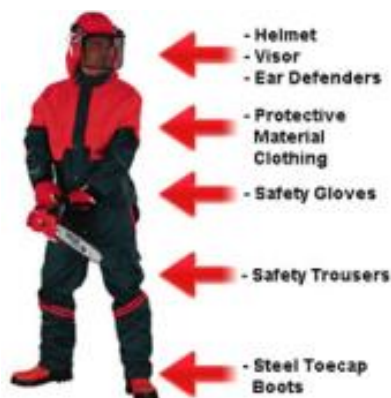
KUVA 3. Metsätöissä suositeltu suojavarustus ( https://favreauforestry.com/safety )

Paikalliset jälleenmyyjät eivät pystyneet toimittamaan suojavarustusta kokonaisuudessaan. Jälleenmyyjillä oli valikoimissaan työkengät ja työkypäret. Kuitenkaan työtakkia, viiltosuojahousuja ja viiltosuojakäsineitä ei ollut mahdollista hankkia paikallisesti. Tämä tarkoittaa sitä, että ne tulisivat toimittaa kauempaa. Kuvassa 3 on kattava suojavarustus metsätöihin moottorisahalla. Suojavarustukseen kuuluvat kypärä silmä- ja kuulosuojalla, suojatakki, viiltosuojahousut, viiltosuojakäsineet ja turvakengät.