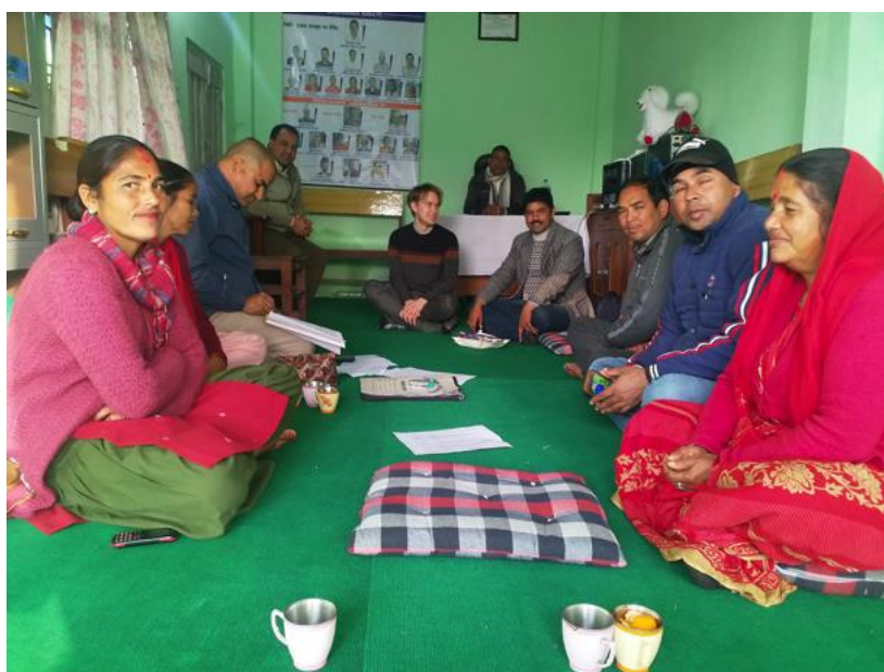
KUVA 1. Tapaaminen erään yhteisömetsän edustajien kanssa Tulsipurissa.