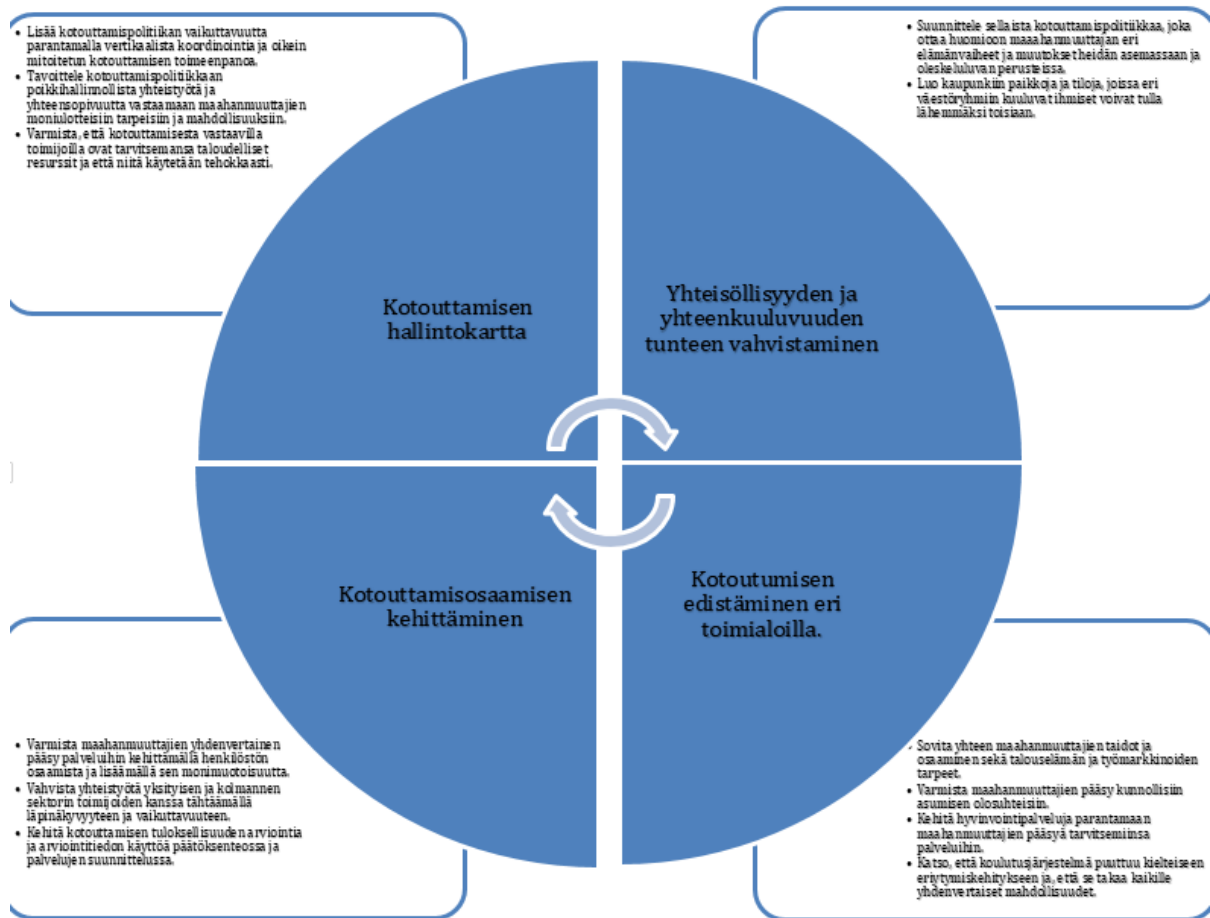
Kuvio 2 Pasi Saukkosen kotouttamisen muistilista. (Saukkonen, 2016)