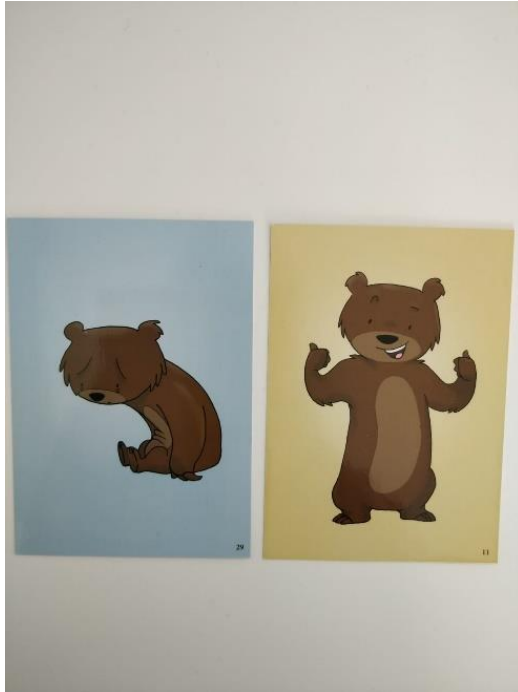
Kuva 3. Lapsi E:n valitsemat nallekortit