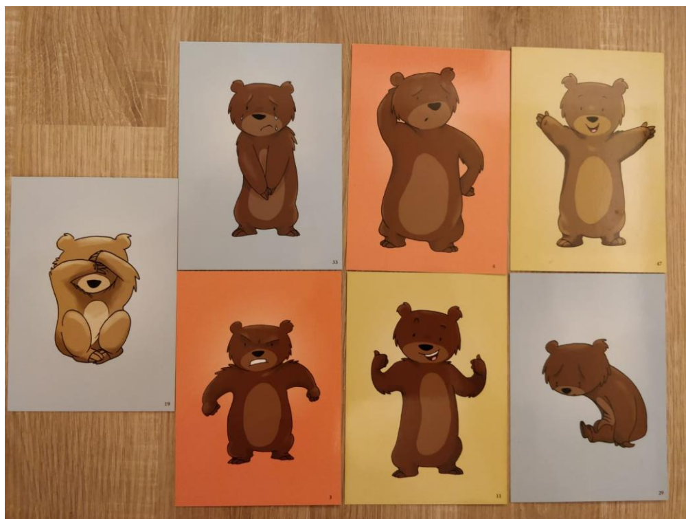
Kuva 1. Haastatteluissa käytetyt nallekortit