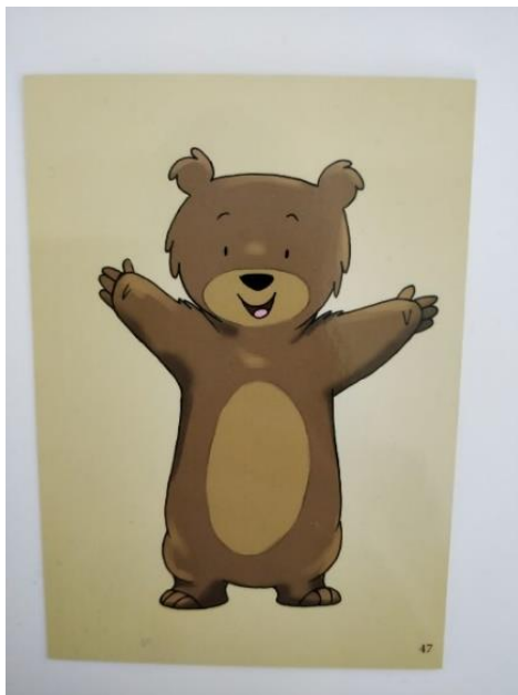
Kuva 4. Lapsi F:n valitsema nallekortti