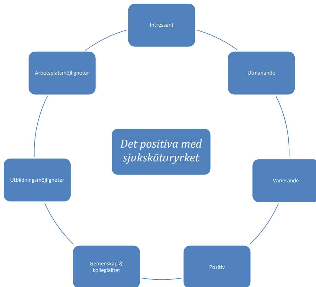
Figur 1 Begrepp att beskriva sjukskötaryrket positivt & realistiskt

I figur 1 Finns faktorer som kan beskriva sjukskötarens yrke ur ett positivt och realistiskt perspektiv. Figuren är sammanställd baserat på analysen av temaintervjuerna som utförts med sjukskötare.