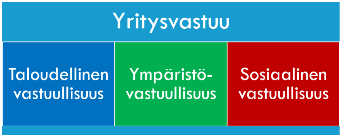
Kuva 1 Yritysvastuun osa-alueet

Kuvassa 1 on havainnollistettu yritys vastuun jako taloudelliseen, sosiaaliseen ja ekologiseen vastuuseen. Yritysvastuu jaetaan useimmiten tämän jo vakiintuneen kolmen pilarin mallin mukaan. (Juholin 2004, 50.)