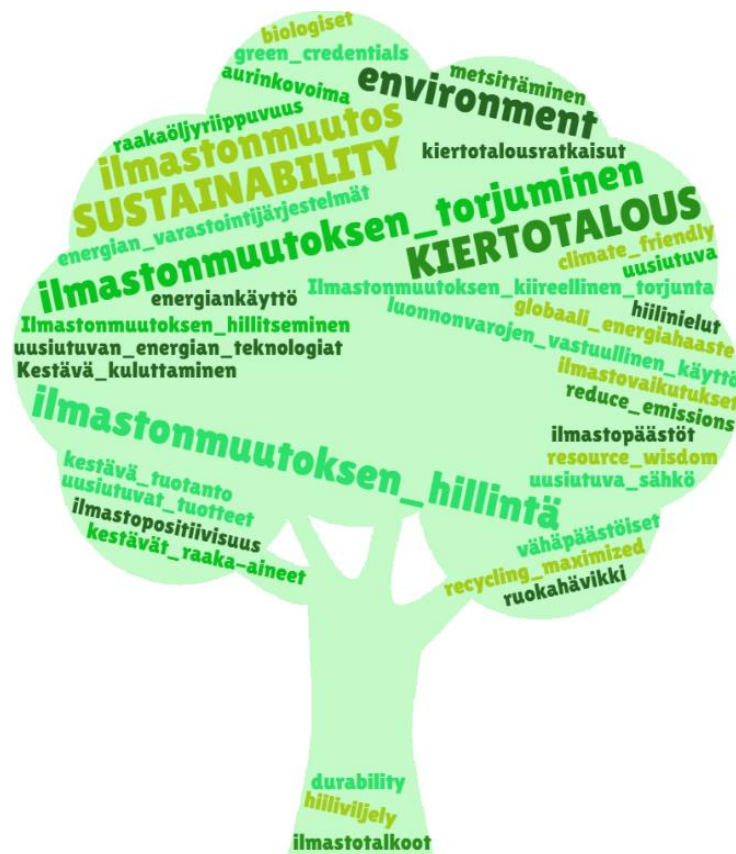
Kuva 4 Ekologisesta vastuusta käytetyt termit