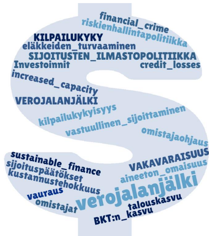
Kuva 6 Taloudellisesta vastuusta käytetyt termit

Kuvassa 6 on esitetty taloudellisesta vastuusta käytettyjä termejä. Puhuttaessa taloudellisesta vastuusta yleisellä tasolla käytettiin muun muassa termejä: