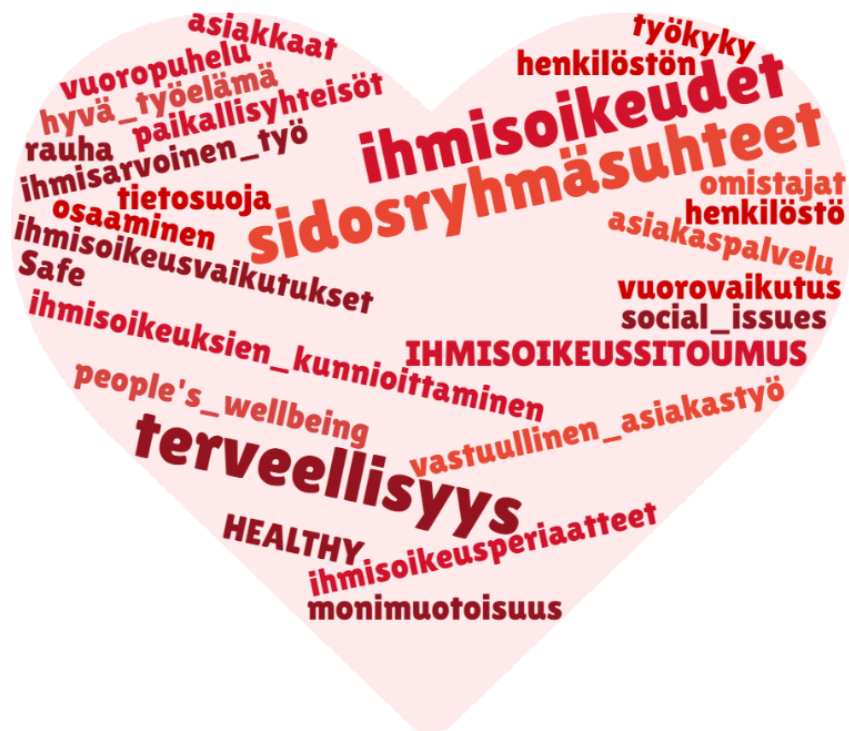
Kuva 5 Sosiaalisesta vastuusta käytetyt termit

Kuvassa 5 on esitetty sosiaalista vastuuta kuvaavia termejä. Sosiaalista vastuuta yleisesti kuvaavia termejä ovat esimerkiksi: