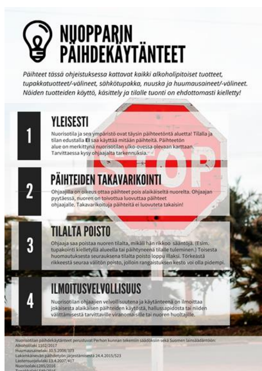
Kuva 3: Nuorisotilan päihdekäytännöt: Nuorten ohjeistus (Viitala 2020).

Nuorten ohjeistuksen luonnos lähetettiin Perhon nuorisovaltuuston jäsenten WhatsApp -ryhmään, jossa pyydettiin kommentteja ja muuta huomioitavaa taulun sisältöön. Tällä pyrin osallistamaan nuoria infotaulun sisällön suunnitteluun ja saamaan heiltä mahdollisesti uusia ideoita tai näkökulmia, miten ohjaajien tulisi vaihtoehtoisesti toimia. Kommentteja nuorilta ei kuitenkaan tullut, joten totesin tuotoksen olevan valmis viimeistelyyn, jonka tein ohjaajien oppaan tavoin Canva -ohjelmalla.