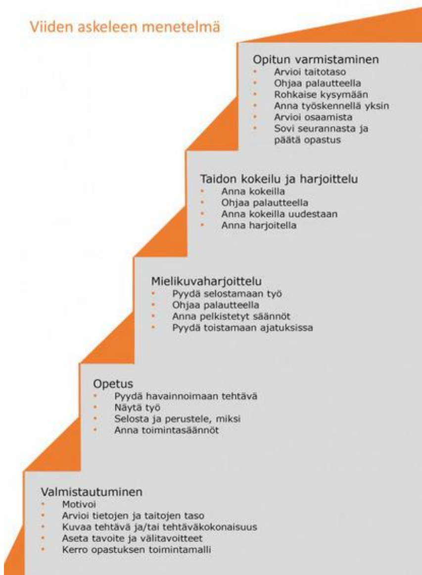
Kuva 2: Viiden askeleen menetelmä (Työturvallisuuskeskus 2013).