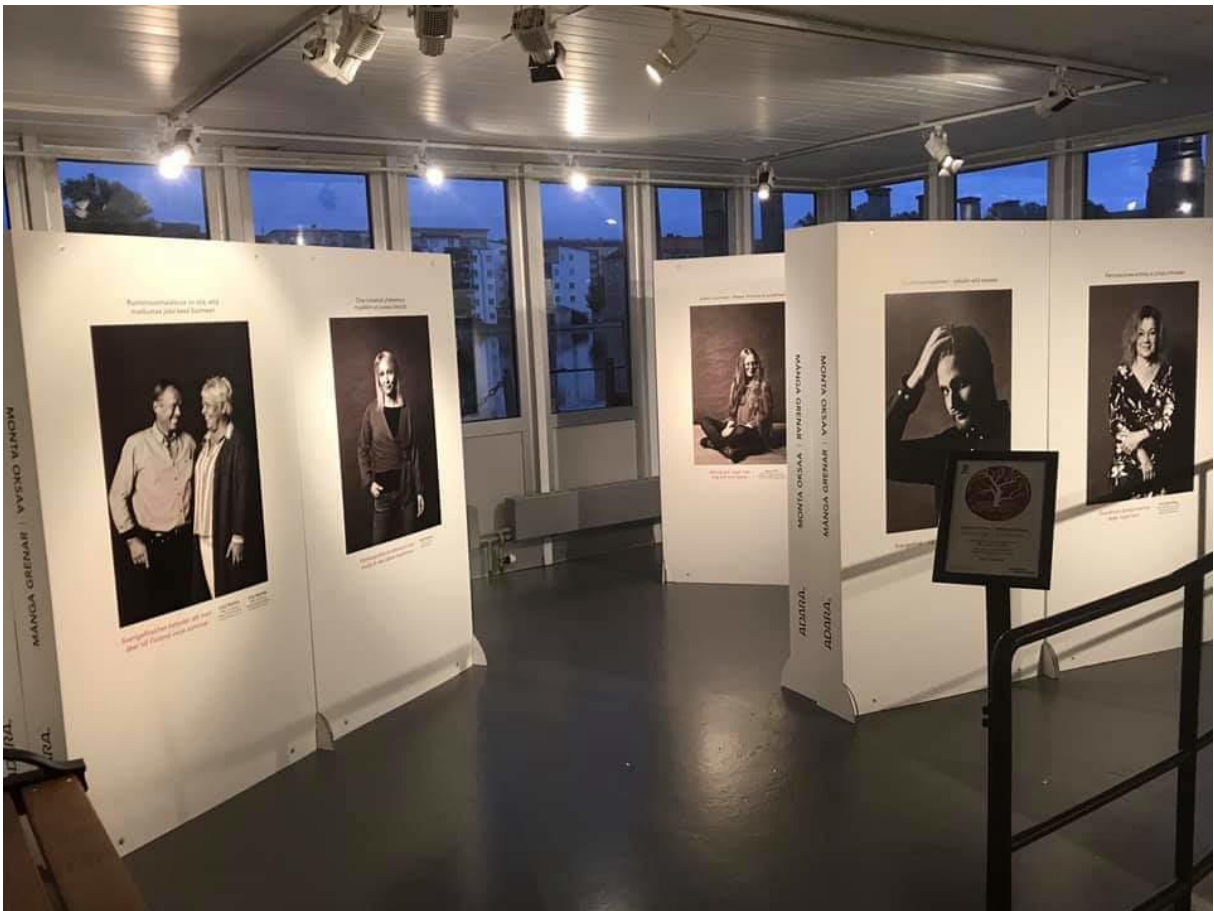
Kuva 2. Näyttely Eskilstunan kaupunginmuseossa