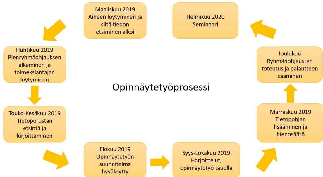
Kuvio 1. Opinnäytetyöprosessi. (Jenni Loijas)

Ennen ryhmäohjauksia kävin kertomassa hieman ryhmästä ja sen ideasta asukkaille. Kuuntelin heidän mielipiteitään ryhmän ideasta ja mahdollista halukkuutta osallistua ryhmään. Riihitien esimies vielä ennen ryhmien ensimmäistä kertaa kyseli asukkaista halukkaita osallistua ryhmään. Päätimme esimiehen kanssa, että ryhmään otetaan omatoimisempia asukkaita, jotta ryhmästä jäisi enemmän heille mieleen asioita, eikä kaikki olisi aivan uutta.