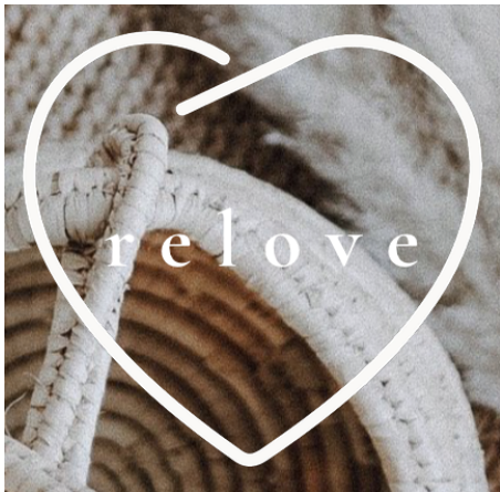
Kuvio 3. Relove logo (Relove).

Logosta ja Relove nimestä asiakas voi helposti päätellä sen olevan second hand -liike. Heillä on selkeä oma logonsa, sydän jonka sisällä lukee pienellä ja kauniilla fontilla Relove. Logo on hyvin elegantti, kaunis ja yksinkertainen. Logon väritykseen on käytetty pelkästään mustaa ja valkoista. Kuviossa 4 on kyseinen logo. Logon väritystä ja taustaa on muokattu Reloven kotisivuihin sopivaksi.