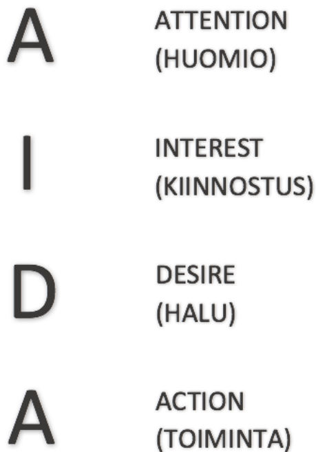
Kuvio 1. AIDA-malli (Markkinointisuunnitelma).

On tärkeää, että visuaalisti tuntee yrityksen kohderyhmän, jotta näyteikkuna on mahdollisimman puhutteleva. Myyntitavoitteisiin yltävään esillepanoon sisältyy erilaisuus, värien yhdistely, siisti ulkoasu, valaistus ja erilaiset sommitteluvaihtoehdot. Myös tilan hahmottaminen on hyvin tärkeä osa näyteikkunan esillepanoa. (Nieminen 2004, 217.) On olemassa useita erilaisia näyteikkunatyyppejä. Voi olla avoin ikkuna, jolloin myymälä on nähtävillä taustalla, näyteikkuna, jonka takaosa on suljettu sekä matalataustainen ikkuna, jota käytetään paljon koru-, käsityö-, kosmetiikka- ja optiikka-alalla. Näyteikkunoissa hyödynnetään paljon erilaisia tasoja ja telineitä, sillä niiden avulla saadaan tuotteita esille eri korkeuksiin. (Nieminen 2004, 218 - 219.) Näyteikkunan toimivuuteen voidaan soveltaa AIDA-mallia. Kuviossa 1 on kuvailtu asiakkaan vaiheet, joka alkaa huomion heräämisestä ja vie ostotoimintaan asti. AIDA-malliin kuuluu, huomion herääminen, kiinnostus, halu sekä toiminta.