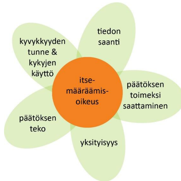
Kuvio 1. Itsemääräämisoikeuden ulottuvuudet. (Topo 2013.)

Itsemääräämisen ulottuvuuksiin kuuluu ajatus asiakkaan omasta kyvykkyydestä. Sosi- aali- ja hoitotyön etiikan näkökulmasta tämä tulkitaan velvollisuudeksi edistää asiakkaan kyvykkyyttä ja näin ollen vahvistaa itsemääräämisoikeuden toteutumista. Fyysisen, psykkisen sekä sosiaalisen toimintakyvyn tukeminen ja ylläpitäminen on itsemäärää- misoikeuden tukemista. (Topo 2013.)