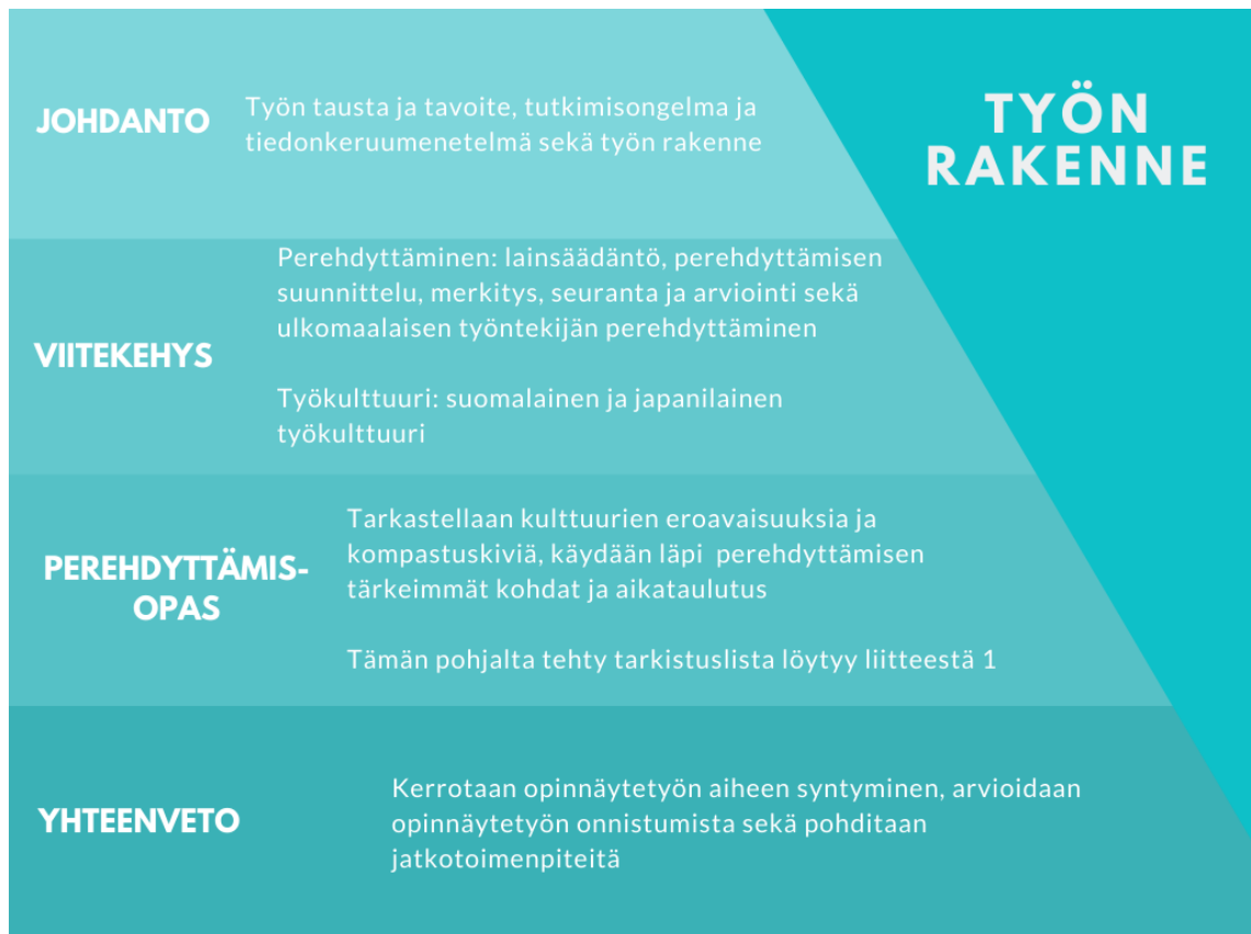
Kuvio 1. Työn rakenne.

Johdannossa (luku 1) käydään läpi opinnäytetyön tavoitteet, tutkimusongelma, tiedonkeruumenetelmä, työn rakenne sekä keskeiset käsitteet. Viitekehys (luvut 2 ja 3) jakautuu kahteen aihealueeseen, jotka ovat perehdyttäminen ja työkulttuuri. Perehdyttämisen aihealueessa käydään läpi mitä perehdyttäminen on, sitä määrittäviä lakeja, perehdyttämisen suunnittelua, merkitystä, seuranta ja arviointia sekä ulkomaalaisen työntekijän perehdyttämistä.