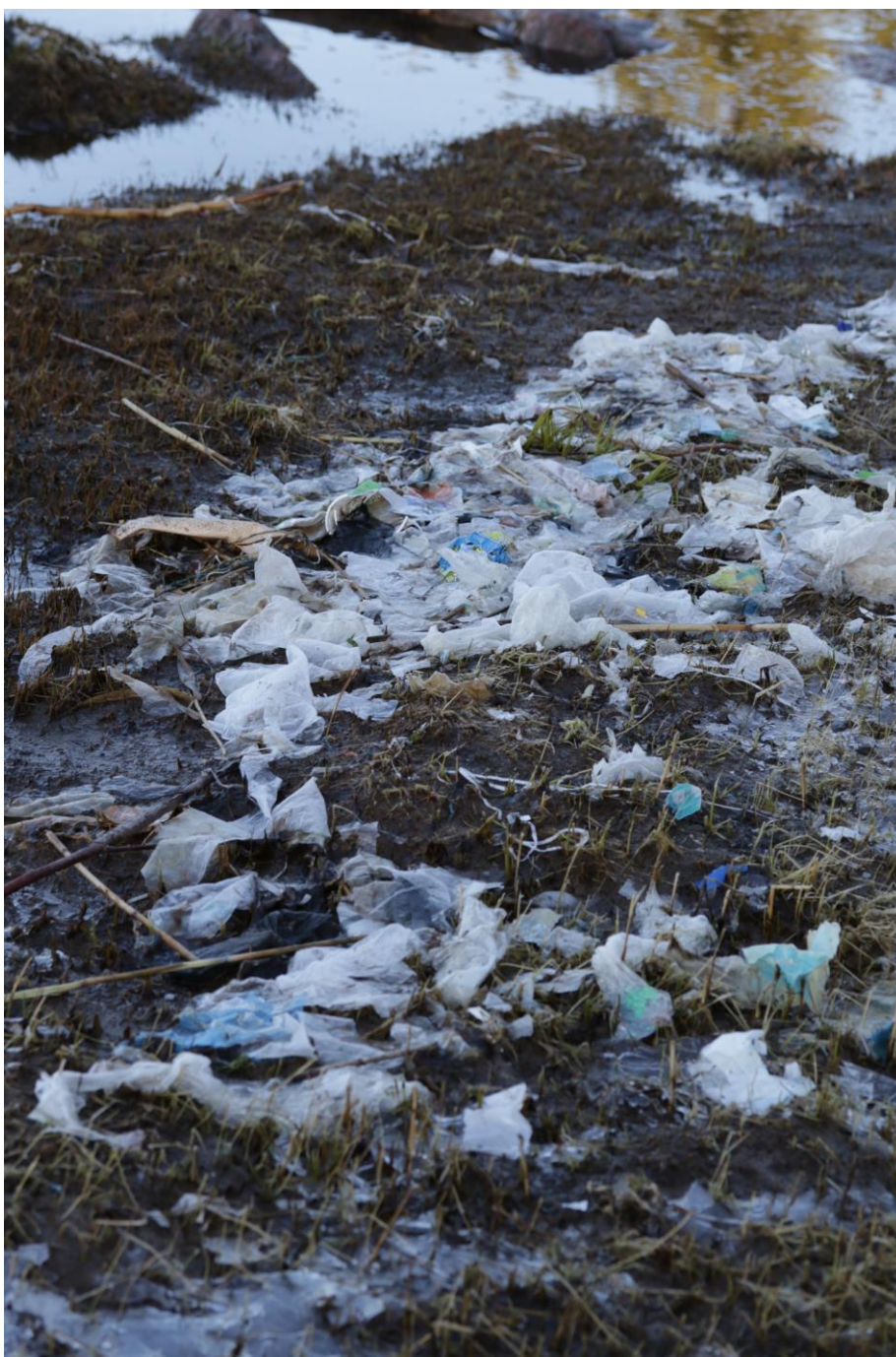
Kuva 6 Lapsuudenkoton läheinen ranta talven jälkeen. (Arja Laajalahti, 2020)

Juuri Mutualta sain idean, että voisin itsekin kerätä rannasta roskat talteen ja muuttaa ne taiteeksi. Kerään perheeni kanssa meren rannalta roskaa keväisin, ja sitä riittää. Surullista, mutta totta, ettei ainakaan materiaalipula iskisi sellaisessa työskentelyssä. Itselleni lapsuuden kotini läheinen merenranta on tärkeä paikka, joten olisi ihanaa tehdä paikkasidonnaisia teoksia samalla kun auttaa luontoa. Ajatus muistojen muuttamisesta fyysiseen muotoon ”niin kutsutuilla paikan antimilla” tuntuu inspiroivalta ajatukselta.