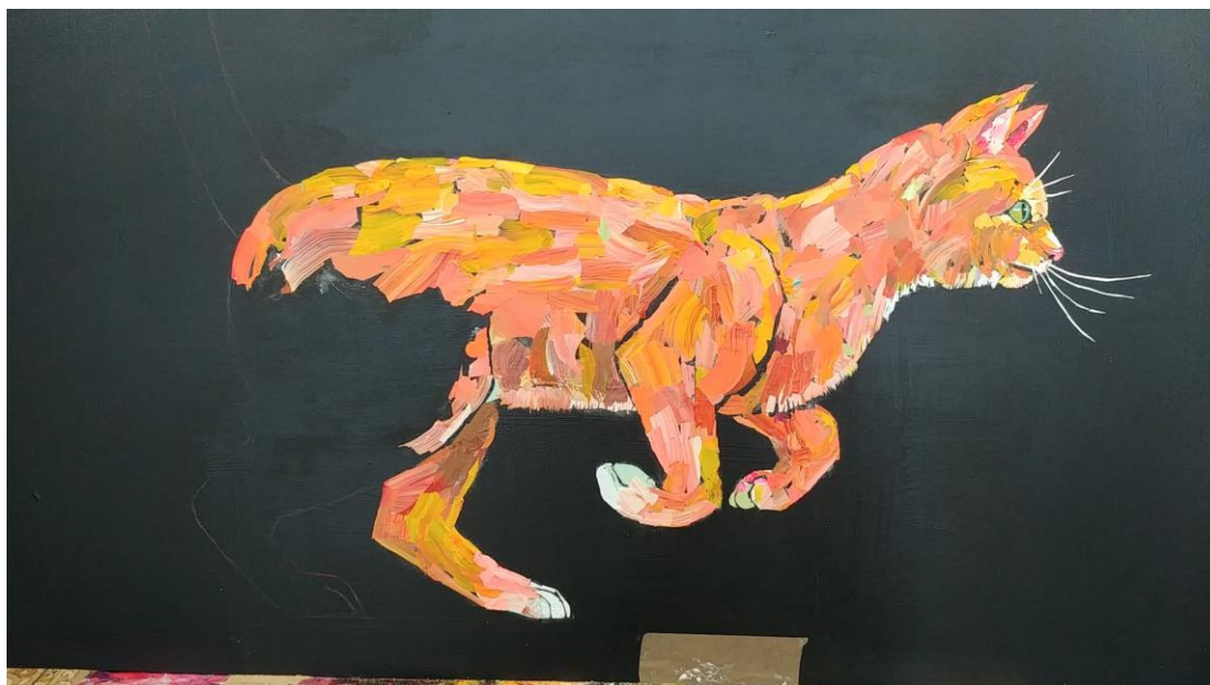
Kuva 4 Ensimmäinen hepulikissa kesken.

Riehuvien kissojen aiheen innoittamana ensimmäinen teos syntyi viikossa. Sen tekeminen oli mieltä tyydyttävää, ja olin tyytyväinen sekä asentoon että väreihin. Silti tarkaraivossani tuntui tästä puuttuvan jotain; ehkä sen takia, ettei tämä ollut alkuperäinen ideani.