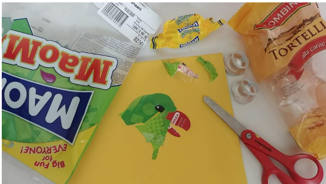
Kuva 5 Työskentelyä Pirikka-papukaijan äärellä.