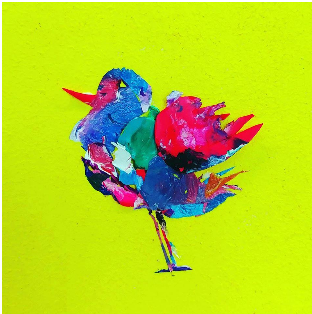
Kuva 1, Lintu, jonka kasvot näin pöydällä olevassa maalin palassa.

Työt olivat aina pieniä, koska maaliroippeet itsessään olivat pieniä. Haaveilin isomman teoksen tekemisestä ja nyt olin saanut tilaisuuteni kokeilla tätä tekniikkaa isommassa koossa.