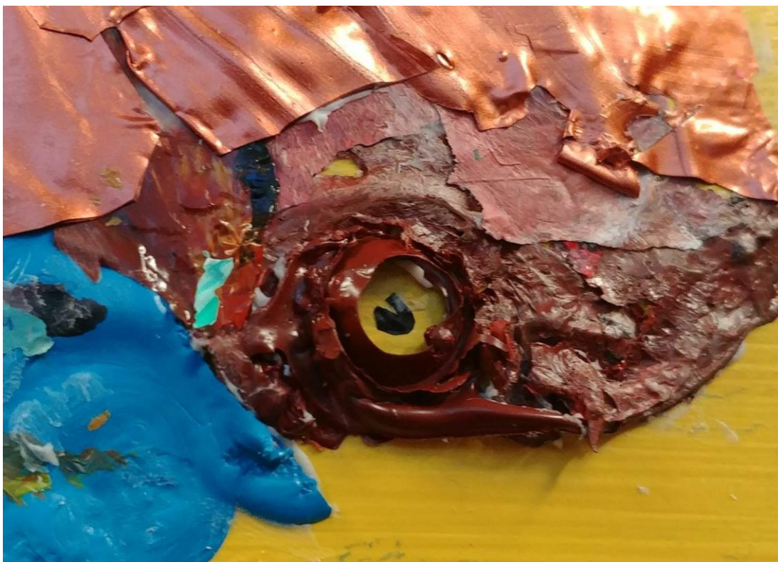
Kuva 2 Lähikuva kasuaarin maalipurkinkorkki silmästä.

Hyvä vain, että aikataulussa on väljää. Jos jotain menee täysin pieleen tällaisessa työssä, niin se on pakko aloittaa alusta. En voi vain maalata huonoa kohtaa uudelleen, vaan pieleen mennyt kohta täytyy putsata ja pohjustaa, ettei työ olisi epätasainen ja suttuinen. Käytän nopeasti kuivuvaa remonttiliimaa, joten kun lyön palan kiinni, se on siinä ja pysyy. Se on tarkoituskin, koska en halua tapella valuvia paloja vastaan tai odotella liiman kuivumista.