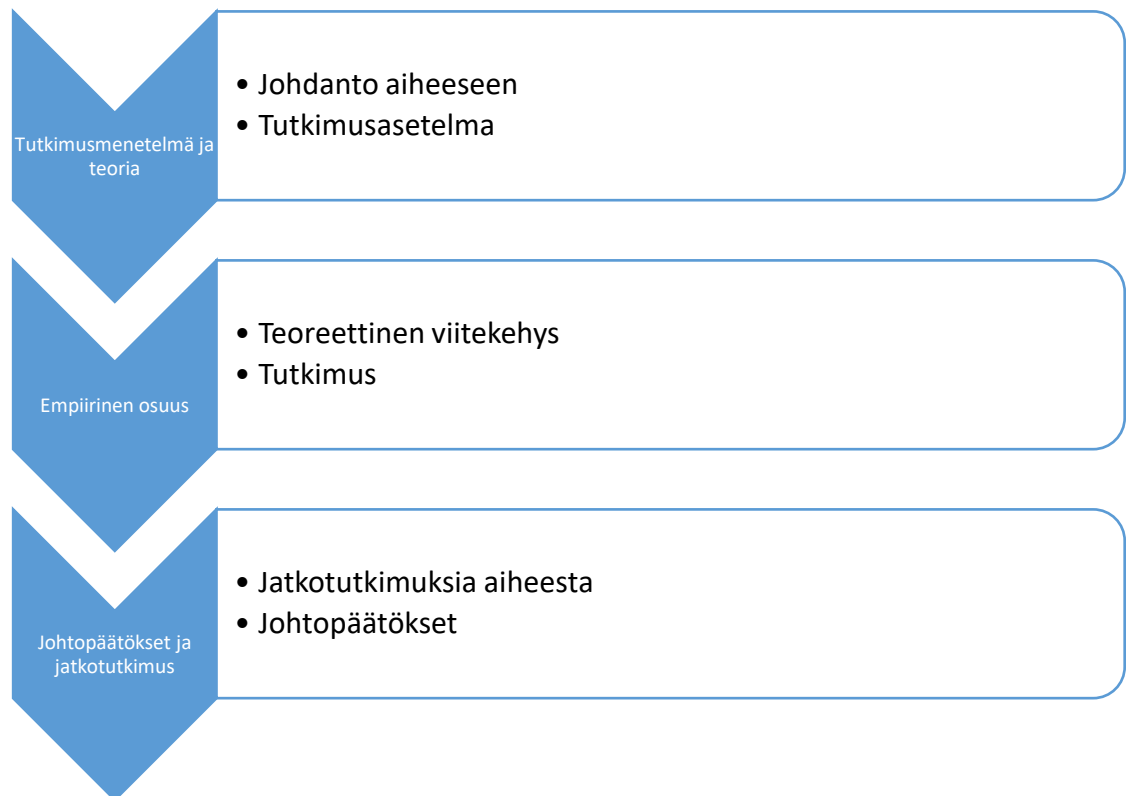
Kuvio 3. Opinnäytetyön eteneminen.

Teoreettinen viitekehys muodostuu asianajajien tapaohjeiden perusarvojen tiiviistä sisällöstä sekä valvontalautakunnan rikkomustapauksista yhdessä riskienhallinnan perusteiden ja riskienhallinnan merkityksen teoriasta. Nämä viitekehukset perustuvat toimeksiantajan liiketoimintaan ja tutkimuskysymyksiä ratkaisuun. Empiirinen eli tutkimusosio koostuu strukturoidusta havainnoinnista sekä kahden asiantuntijan teemahaastattelusta. Haastateltavat tiesivät aihepiirin ennakkollisesti, mutta eivät tarkkoja kysymyksiä. Tutkimussuunnitelma sekä teemahaastattelun kysymyspatteristo on käsitelty ja hyväksytty toimeksiantajayrityksen toimitusjohtajan kanssa. Kuviossa 3 visualisoidaan opinnäytetyön rakennetta jakamalla tutkimus kokonaisuudessaan kolmeen pääosiin.