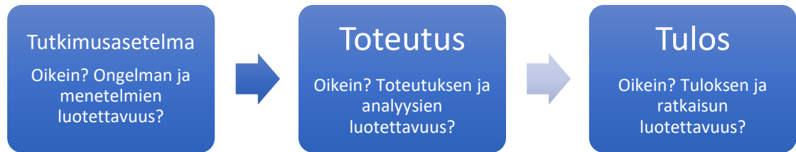
Kuvio 2. Tutkimuksen luotettavuuden mittaaminen prosessina.

Luotettavuusarviointi tutkimustuloksissa perustuu tutkijan perusteltuun näkökulmaan. Se, että mitataan oikeita asioita, eli validiteetti, liittyy tutkimusasetelmaan ja tutkimussuunnitelmaan sekä syy-seuraussuhteiden arviointiin. Oikea tutkimusongelman ja tutkimuskysymysten määrittely on edellytys oikeuden tutkimustulosten tuottamiselle. (Kananen 2014a, 145–149.)