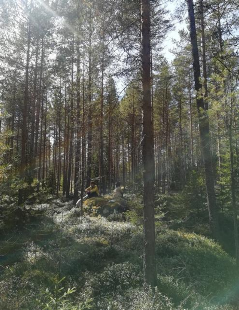
KUVA 2. Arkaaiset-ryhmän jäseniä laulamassa luonnossa (Lindqvist 2019)