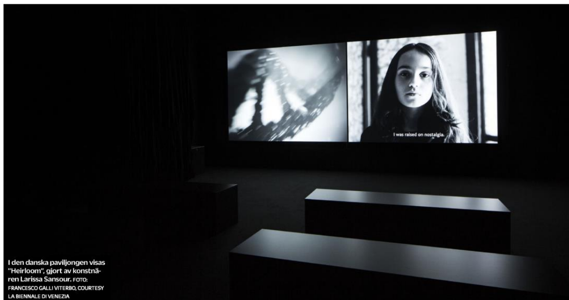
I den danska paviljongen visas "Heirloom", gjort av konstnären Larissa Sansour.