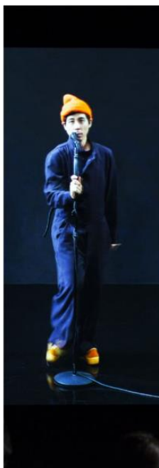
I den schweiziska paviljongen visas "Moving Backwards", som är gjort av konstnärduon Pauline Boudry och Renate Lorenz.