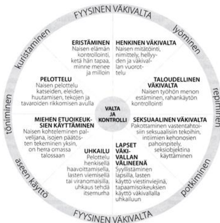
Kuva 2. Parisuhdeväkivallan ulottuvuuksia kuvaava kuvio, väkivallan ja kontrollin ympyrä (kuva: Säävälä ym. 2006, s. 19).

Henkinen väkivalta on aina subjektiivinen kokemus, jonka kaikki uhrin kokevat eri tavoin ja myös reagoivat siihen eri tavoilla. Säävälä ym. (2006, 19) on kuvannut teoksessaan väkivallan ja kontrollin ympyrän. Kuvassa 2 esiintyvä ympyrä jakaa väkivallan erilaisiin osa-alueisiin ja kuvaa erilaisia väkivallan muotoja. Kyseinen teos, josta kuvio on lainattu, on Oulun ensi- ja turvakoti Ry:n kanssa toteutettu ja se keskittyy käsittelemään parisuhdeväkivaltaa siltä kannalta, että nainen on uhrina ja mies väkivallan käyttäjänä. Tämän näkökulman vuoksi kyseinen kuvio keskittyy pääasiassa määrittelemään miehen väkivallan käyttäjänä ja naisen uhrina. On kuitenkin hyvä muistaa, että väkivaltaa voivat yhtä lailla käyttää niin miehet kuin naisetkin, ja uhrina voi olla kumman sukupuolen edustaja tahansa.