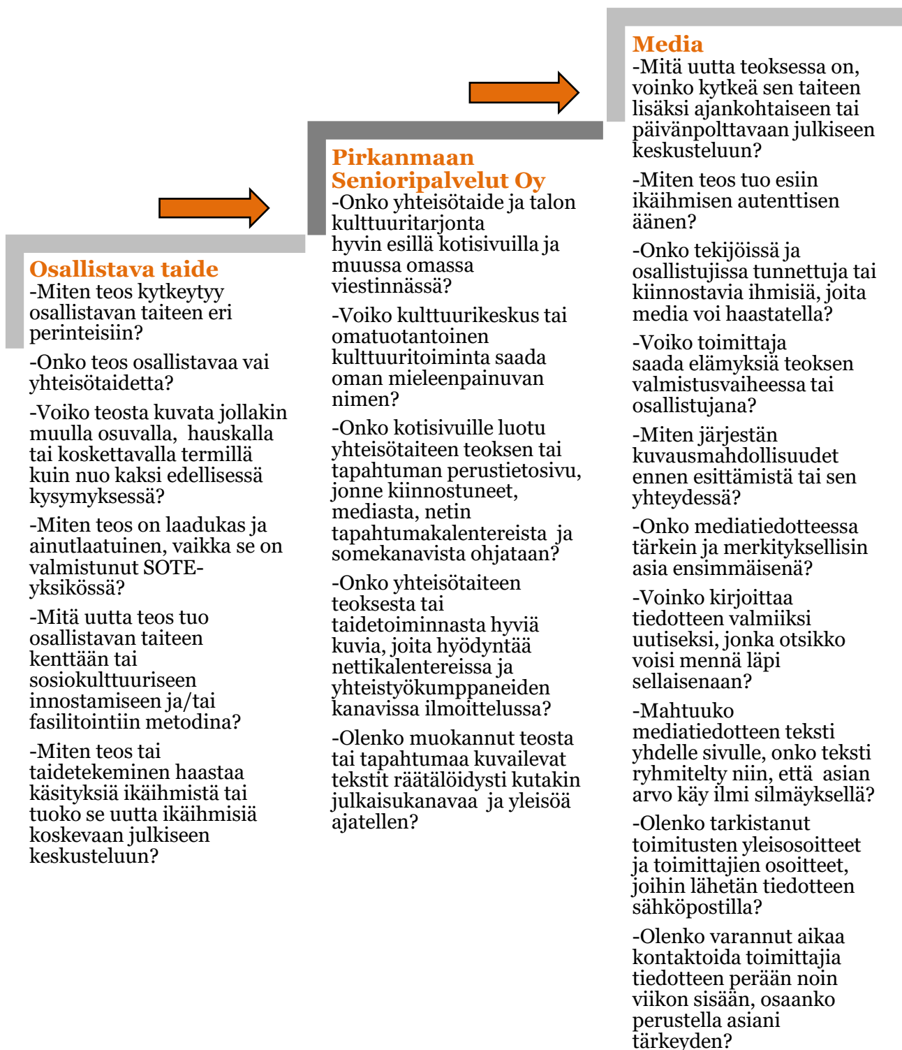
KUVA 3. Kehittämisehdotusten muistilista PSP:n yhteisötaiteen oman näkyvyyden, osallistavan taiteen ja medianäkyvyyden näkökulmista