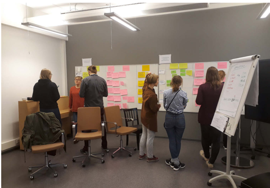
Kuva 2. Opiskelijoiden itsearviointityöpajassa arviointimatriisin ääressä

Koska itsearviointin tavoitteena oli tarkastella Suomalaisen musiikkikampuksen toimintaa kokonaisuutena, aineiston jatkokäsittelyssä yhdistettiin opiskelijoiden, johdon ja henkilöstön työpajojen tulokset teema-alueittain ja arviointikohteittain. Sen jälkeen toiminnan vahvuudet, kehittämiskohteet ja ratkaisuehdotukset luokiteltiin arviointikohteittain. Lopuksi vielä koottiin kehittämiskohteiksi ja niiden ratkaisuehdotuksiksi luokitellut asiat kustakin arviointikohteesta ja ne yhdistettiin toiminnan kehittämisehdotuksiksi.