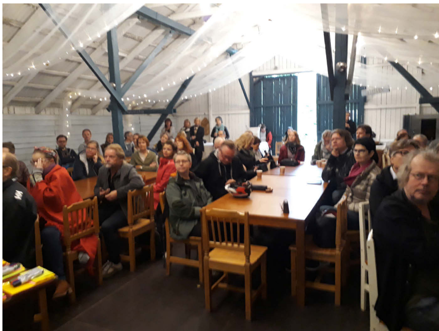
Kuva 1. Henkilöstön työpajan orientaatio EduFutura kehittämispäivässä.

Opiskelijoiden ja johdon työpajat olivat osallistujamääriltään pienempiä, kestoltaan kaksi tuntia ja ne toteutettiin JAMKin tiloissa. Henkilöstön itsearviointityöpaja järjestettiin osana Suomalaisen Musiikkikampuksen henkilöstön yhteistä EduFutura kehittämispäivää Muuramessa ja siihen osallistui 60 henkilöstön edustajaa. (ks. Kuva 1)