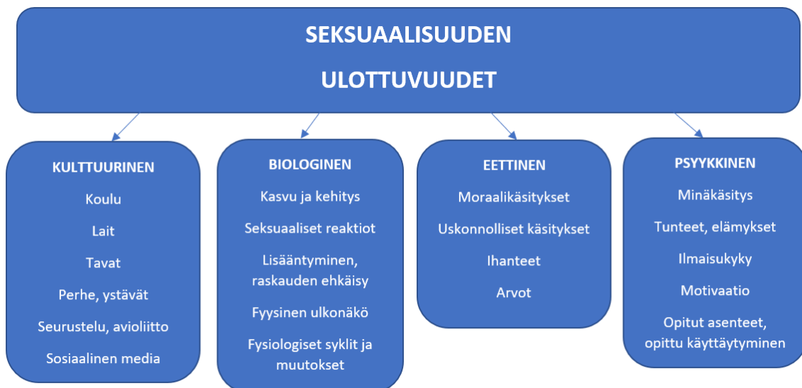
KUVIO 1. Seksuaalisuuden ulottuvuudet

Biologinen ulottuvuus kattaa fyysiseen seksuaalisuuteen liittyviä asioita. Siihen kuuluu muun muassa fyysinen ulkonäkö, kasvu ja kehitys, hormonaalinen kehitys sekä reaktiot seksuaalisiin ärsykeisiin. Yksilöön itseensä ja muihin kohdistuvista ajatuksista, tunteista, asenteista sekä kokemuksista muodostuu psyykinen ulottuvuus. Eettinen ulottuvuus näkyy suhtautumisena, arvoina, asenteina ja rajoina siinä, mitä yksilö pitää seksuaalisuudessa normaalina, hyvänä ja hyväksyttävänä. Yhteisössä vallitsevat seksuaalitavat, seksuaalimoraali ja seksuaalisuutta koskevat tiedot sekä uskomukset ovat osa kulttuurillista ulottuvuutta. Niitä ilmentävät esimerkiksi kieli, kirjallisuus, kuvat, musiikki sekä tanssi. (Digma, 2013, viitattu 11.9.2019.)