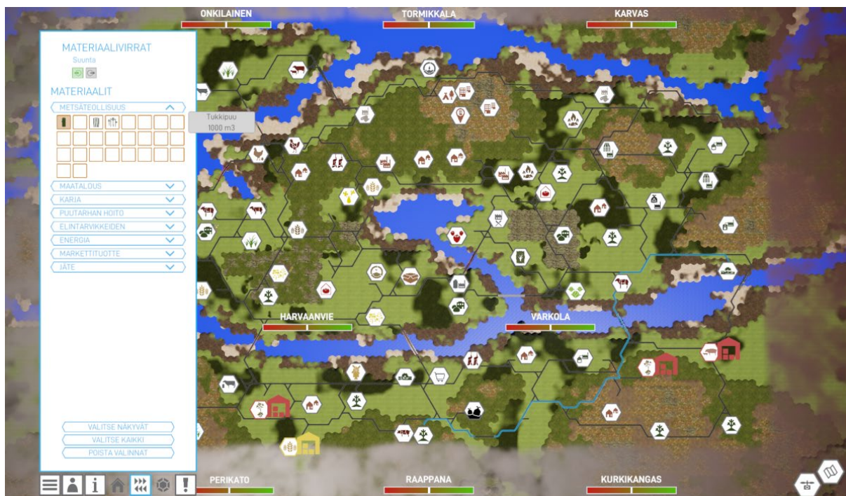
Kuva 2. Ote biotalouspelin karttanäkymästä

Biotalouspelin tavoitteena oli tuoda uusi pedagoginen lähestymistapa ja menetelmä biotalouden monimutkaiseen kokonaisuuteen hahmottamista tukemaan. Pelillistämisen tarkoituksena on myös tehdä biotaloudesta houkuttelevampaa ja helpommin lähestyttävää opiskelijan näkökulmasta.