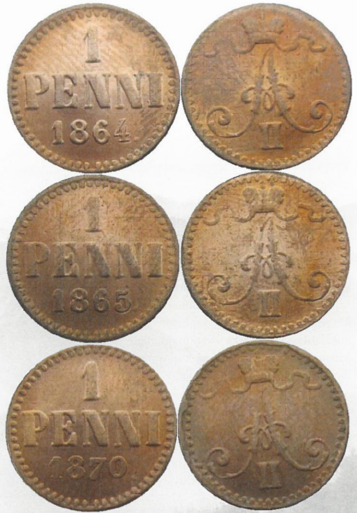
Kuva 2. Vertailua 1 pennin Kiinan kopioista 1864, 1865, 1870. Selkeästi huomaa, että kopioijat ovat hyödyntäneet samaa meistipohjaa vain muuttaen vuosiluvun loppunumeroa. Kuvien muokkaus ja yhdistely: Jorma Imppola.

Vuoden 1870 1 pennin kuparirahan kopio on varsin petollinen, ja sen erottaminen aidosta vaatii jo hieman tarkempaa tarkastelua. Kopion paino on noin 1,78 grammaa, eli huomattavasti normipainoa 1,28 grammaa enemmän. Väärennetyssä vuoden 1870 pennissä on arvopuolella selkeä virhe vuosiluvun numeroiden sommittelussa. Vuosiluvun numeron 7 ylä- ja alaosa ovat aidossa rahassa liki numeroiden 1 ja 8 tasolla ja lopun piste on selkeästi numeroiden 1, 8 ja 7 alatasoa ylempänä. Ero käy hyvin ilmi kuvan 3 punaisen havainneviivan avulla.