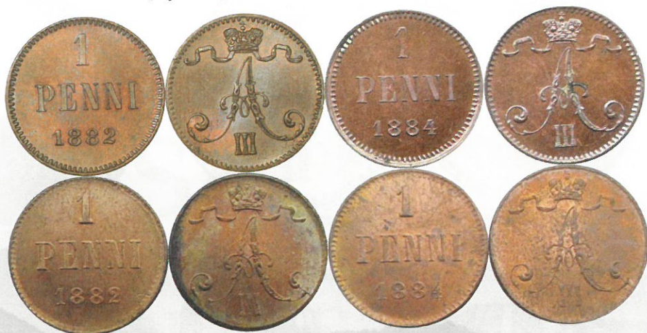
Kuva 4. Vuosien 1882 ja 1884 1 pennin aitojen hyväkuntoisten kuparirahojen vertailua kiinalaisiin kopioihin. Ylempänä aito raha ja sen alapuolella kopio. Kuvien muokkaus ja yhdistely: Jorma Impola.