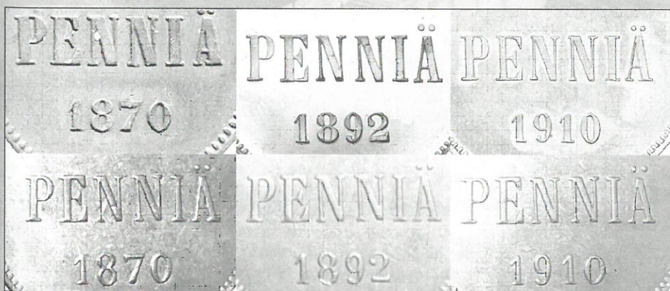
Kuva 8. Aitojen ja väärrien 5 pennin rahojen 1870, 1892 ja 1910 arvo- ja tunnuspuolten tekstien ja vuosilukujen vertailua. Aidot ylimmä, tekeleet alinna. Huomatkaa tekeleiden kirjainten ja numeroiden heiveröisyys ja epätarkkuus aitoihin verrattuna.