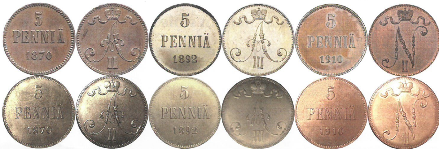
Kuva 7. Aitojen ja väärrien 5 pennin rahojen 1870, 1892 ja 1910 vertailua. Aidot ylimmä, tekeleet alinna. Tekeleistä on kaupan COPY-stanssattuja ja stanssaamattomia versioita.