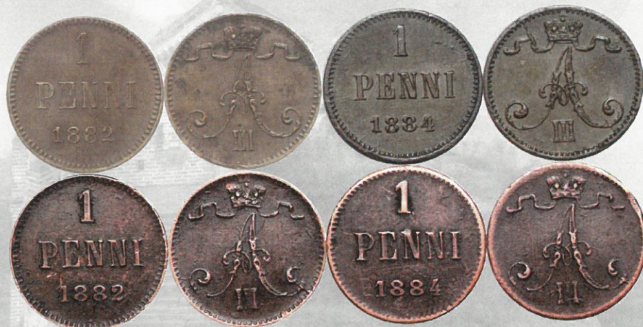
Kuva 5. Vuosien 1882 ja 1884 1 pennin ylinnä olevien aitojen tummuneiden kuparirahojen vertailua alinna oleviin kiinalaisiin kopioihin.