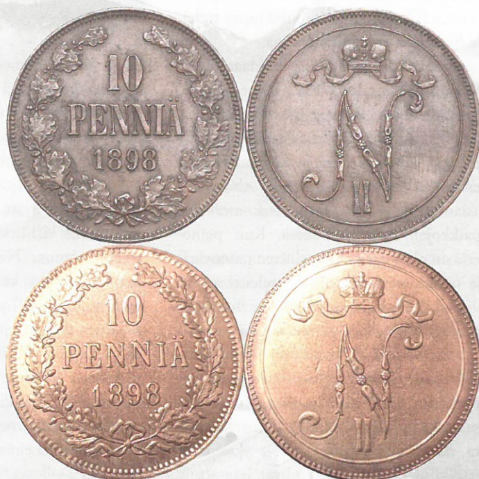
Kuva 9. Aidon ja väärän 10 pennin rahan 1898 vertailua. Aidot ylimmä, tekeleet alinna. Huomatkaa tekeleiden kirjainten ja numeroiden heiveröisyys ja epätarkkuus aitoihin verrattuna. Myös tekeleen tammenlehväseppelä poikkeaa erittäin huomattavasti aidosta. Tekeleistä on kaupan COPY-stanssattuja ja stanssaamattomia versioita. Kuvien yhdistely ja muokkaus: Jorma Imppola.