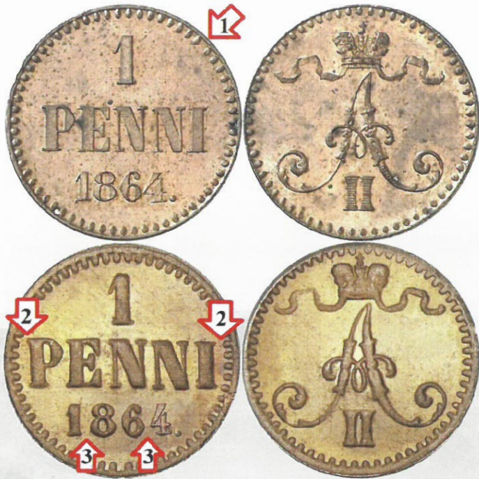
Kuva 1. Aito vuoden 1864 penni ylempänä, kopio alempana. Kuvien muokkaus ja yhdistely: Jorma Imppola.

Klassinen virhe on arvopuolen helmireunan kello 13:30 kohdalla oleva aukko, joka Kiinan tekeleestä puuttuu (1). Toinen tunnistustekijä on sanan PENNIÄ liian suuri koko, jonka huomaa tekstin ja reunan hyvin pienistä väleistä (2). Kolmas tunnistustekijä on vuosiluvun liian suuri leveys, minkä huomaa erityisesti numeroiden 1 ja 8 sekä 6 ja 4 suurista väleistä (3). Rahan mallina on kopioinnissa käytetty myöhempää mallin 1865 - 1871 isompikirjaimista Aleksanteri II:n penniä.