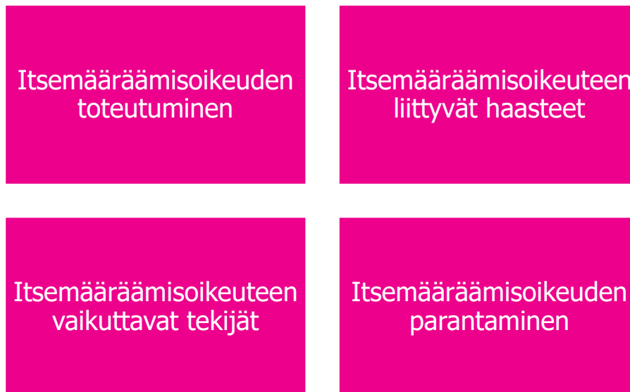
KUVIO 2. Haastattelun teemat.

Tutkimuksen tulokset käytiin teemoittain läpi. Osaa lainauksista muokattiin siten, että tunnistettavat tekijät poistettiin, esimerkiksi osastojen ja henkilöiden nimet. Kuviossa 2 näkyvät haastattelun teemat.