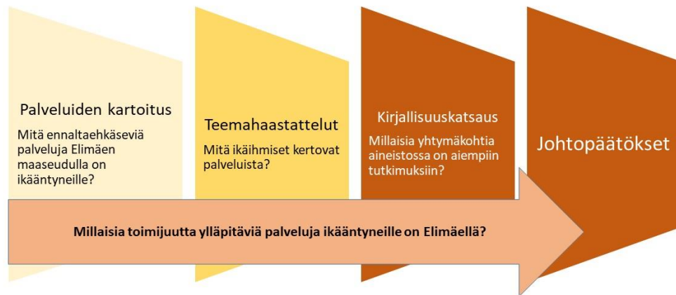
KUVA 2. Opinnäytetyön prosessin vaiheet

vaihe on ikäihmisten haastattelut, joilla haetaan vastausta alakysymykseen kaksi. Alakysymykseen kolme haetaan vastausta kirjallisuuskatsauksella. Prosessin etenemisen kuvaus esitetään kuvassa 2.