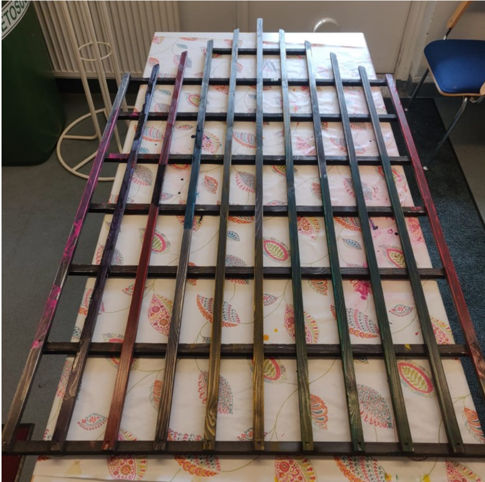
Kuva 2 Maalattu näkösuoja

Asukkaan osallisuutta vahvistettiin antamalla valinnan varaa projektin tekemisessä. Asukkaat saivat valita värin, jolla maalata, ja saivat halutessaan sekoittaa värejä. Heille oli varattu erilaisia välineitä maalaamiseen, kuten erilaisia vaahtomuoviteloja ja pensseleitä. Asukkaat saivat valita välineistä mieluisimman. Lakanoiden väreissä ja ko'issa oli valinnanvaraa, ja asukas valitsi niistä haluamansa. Lakanaa sai repiä mistä kohtaa halusi ja sen kokoiseksi kuin halusi (Kuva 3). Osallisuuteen kuuluu vahvasti mahdollisuus vaikuttamiselle. Asukkaan tulee saada esittää mielipiteensä esteettömästi ja mutkattomasti. (Kari ym., 2020 s. 126)