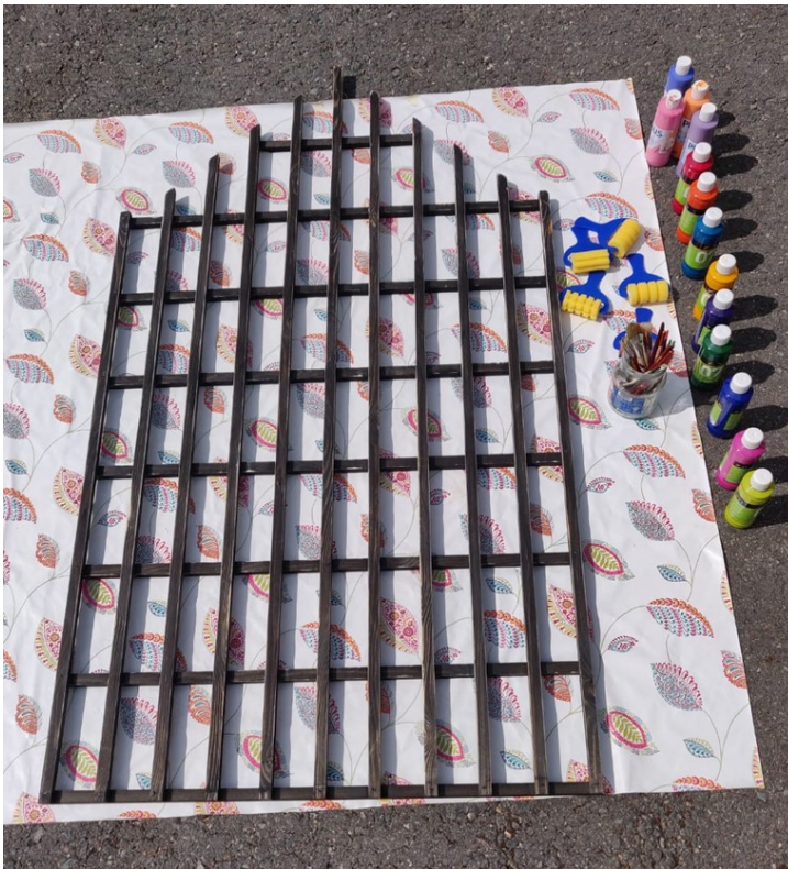
Kuva 1 Valmisteltu näkösuoja

Yksikön esimies toivoi, että yksikön yhteisessä työyhteisöpalaverissa taideteosta esiteltäisiin alustavasti, jotta työyhteisö olisi tietoinen tulevasta projektista ja sen tavoitteista. Ohjaajille kerrottiin, mistä projektissa on kyse, mitä ohjaajilta ja asukkailta odotetaan sekä miten ja minkälaista aineistoa työskentelystä kerätään. Pyrkimyksenä oli varmistaa, että asukkaan tullessa työskentelemään projektiin hänen mukanaan tulisi tuttu ohjaaja, mieluiten asukkaan omaohjaaja. Lopuksi vielä kerrottiin, että projektista tiedotetaan myöhemmin lisää ja että mahdollisia kysymyksiä projektista voi esittää koska vain.