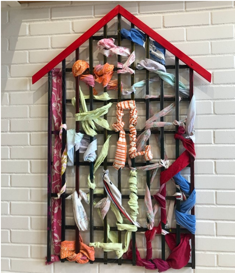
Kuva 7 Valmis työ seinällä taideavajaisissa

Avajaisissa jaettiin taideavajaisiin osallistuville ohjaajille yhteisöllisyyttä käsittelevä kyselylomake (Liite 2). Se pyydettiin palauttamaan mahdollisimman pian tapahtuman jälkeen, jotta havainnot yhteisöllisyydestä olisivat mahdollisimman tuoreita ja luotettavia. Taideavajaisista asukkaat lähtivät kahviteltuaan omiin koteihinsa. Jokainen sai olla avajaisissa haluamansa ajan, eikä ketään velvoitettu olemaan siellä pidempään kuin tahtoi.