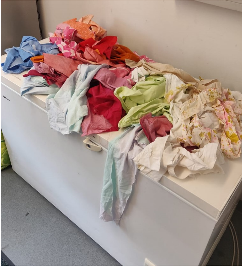
Kuva 3 Revityt lakanat