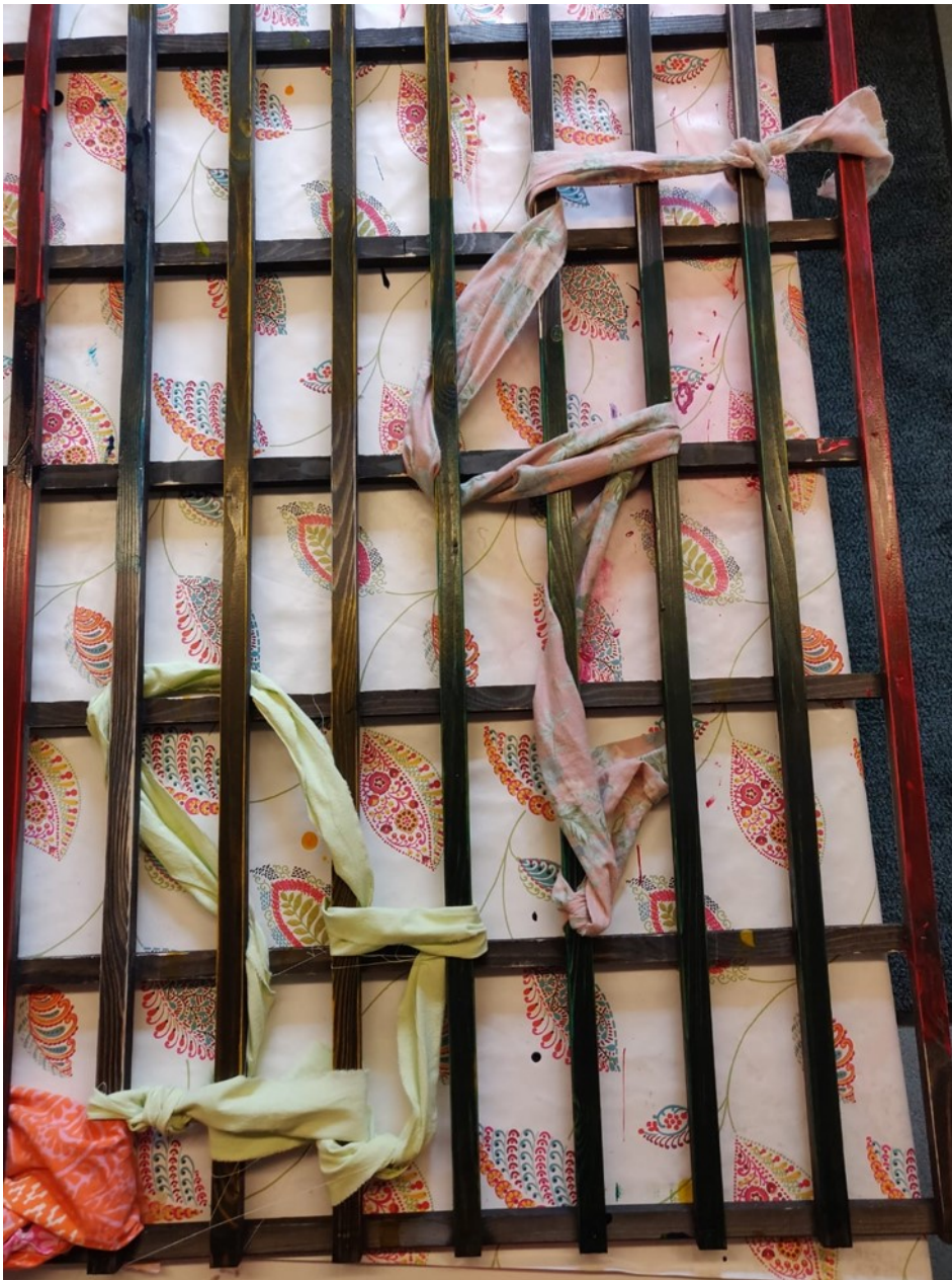
Kuva 4 Pujotellut lakanat

Asukas sai päättää itse, missä paikassa ja asennossa työtä tekee. Näin tekeminen on mahdollisimman mieluista asukkaalle. Ajan tekemiseen määritteli myös asukas itse. Hän sai päättää milloin mikäkin vaihe oli valmis ja milloin hänen osuutensa on tehty. Osa asukkaista oli työskentelemässä 15 minuuttia ja osa kaksi minuuttia. Mukana olleita ohjaajia pyydettiin täyttämään osallisuutta käsittelevä kyselylomake mahdollisimman pian osallistumisensa jälkeen, jotta he muistaisivat mahdollisimman tarkasti, miten projektin tekeminen oli sujunut.