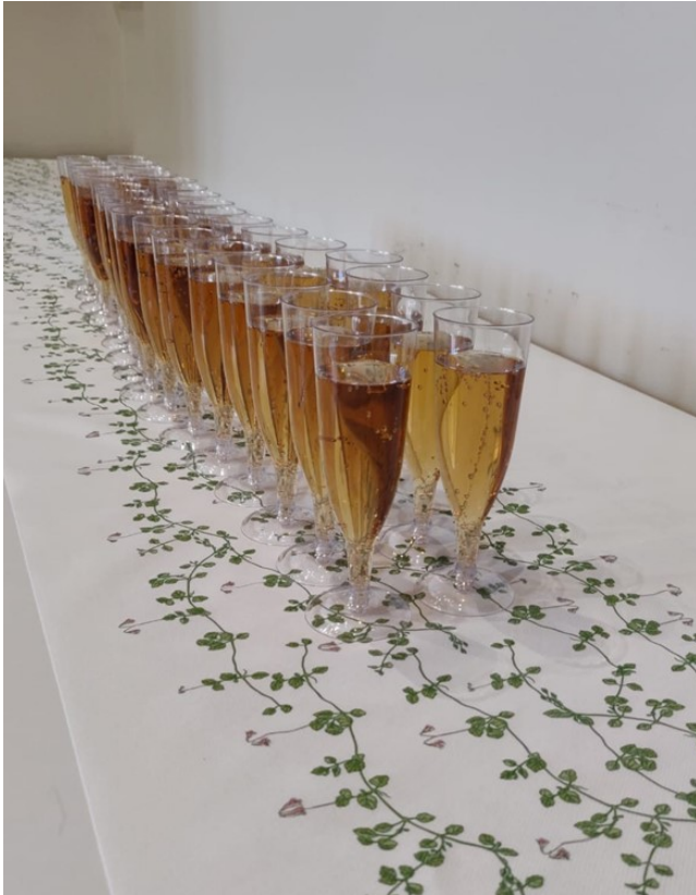
Kuva 6 Avajaisten juhlapöytä