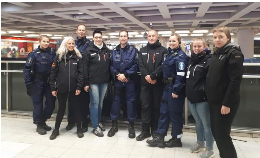
Kuva 5, Kuvassa Helsingin Poliisin Ennaltaestävä toiminto, Live-palveluiden, Stadin Jalkautujien, Aseman Lasten sekä Ntr-Helsingin työntekijöitä Helsingin Päärautatieaseman Asematunnelissa. (Sauli Taipale)

Katsottiin vastauksissa laajemminkin koko Helsingin kaupungin jalkautuvaa nuorisotyötä, sekä sen organisoinnin ja yhteistyöhön liittyviin haasteisiin. Koettiin että tiiviimpää yhteistyötä olisi hyvä tehdä kaupungin toimijoiden kesken. Toisaalta, tuli myös vahva viesti, pks- ja järjestöyhteistyön hyvästä toimivuudesta.