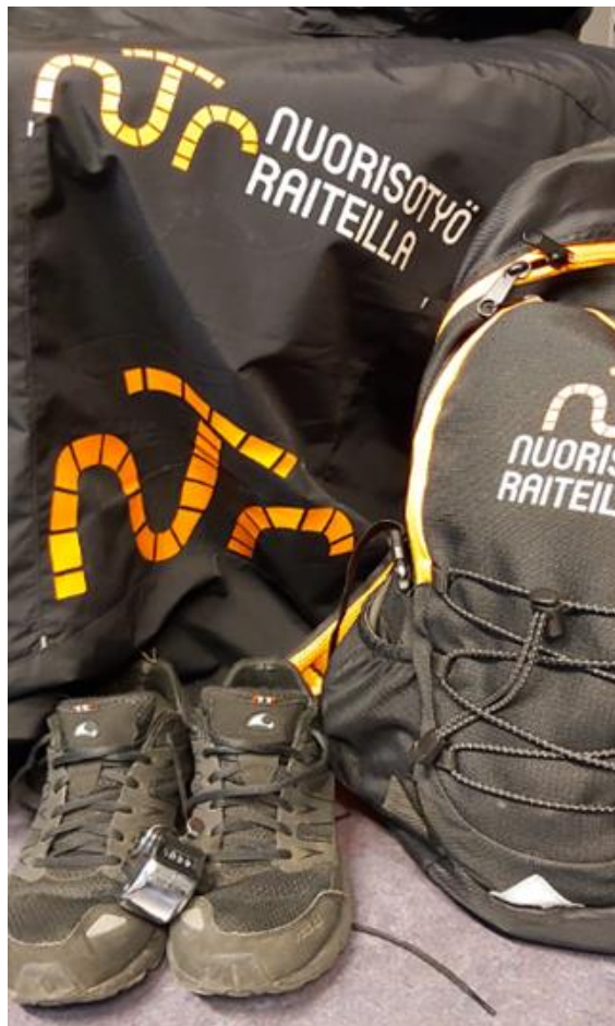
Kuva 1, Työvälineet jalkautuvaan nuorisotyöhön

Opinnäytetyön tavoitteena on näyttää toteen hankkeen tarpeellisuus nuorisotyössä ja pääkaupunkiseudun katukuvassa.