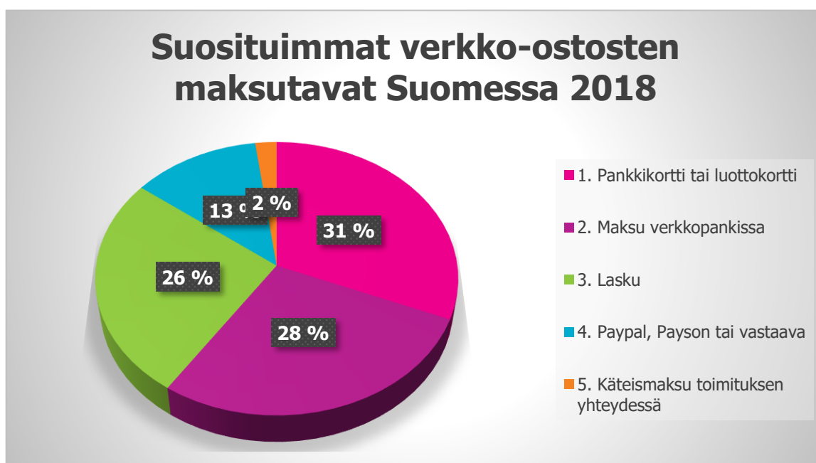
KUVA 2. Suosituimmat verkko-ostosten maksutavat Suomessa 2018 (Postnord 2019).

Postnord (2019) on tehnyt tutkimusta ihmisten verkkokauppakäyttäytymisestä Pohjoismaissa ja eräässä tutkimuksessa on saatu selville, että suomalaisten mieluiten käyttämät verkkomaksutavat vuonna 2018 olivat pankki- tai luottokortti, maksu verkkopankissa ja lasku (kuva 2). Samantyyppisiin tuloksiin on tultu myös muissa tutkimuksissa, vuosina 2019 ja 2020. Tutkimusta aiheesta ovat tehneet esimerkiksi maksunvälityspalveluita tarjoavat yritykset Paytrail ja Svea Ekonomi. Molemmat tutkimukset ovat tulleet tulokseen, että suomalaisten suosituin maksutapa verkkokaupassa on maksu verkkopankissa ja korttimaksut tulevat hyvänä kakkosena, laskulla maksamisen jäädessä kolmanneksi sijalle (Paytrail 2019, Svea Ekonomi 2020).