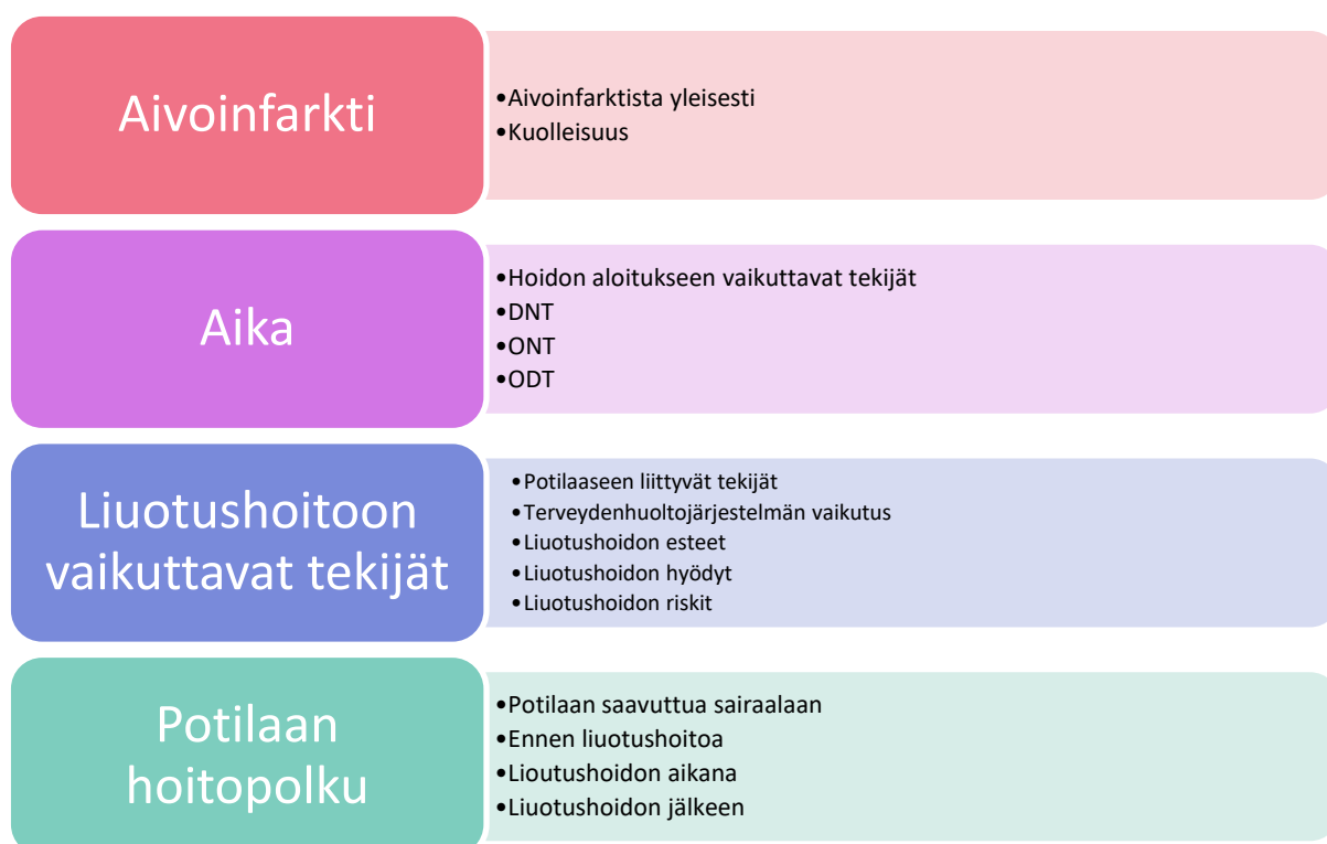
KUVIO 3. Ylä- ja alaluokat

Tämän kuvailevan kirjallisuuskatsauksen mukaan yläluokiksi muodostuivat aivoinfarkti, aika, liuotushoitoon vaikuttavat tekijät sekä potilaan hoitopolku. Ylä- ja alaluokat ovat nähtävissä kuviossa 3.