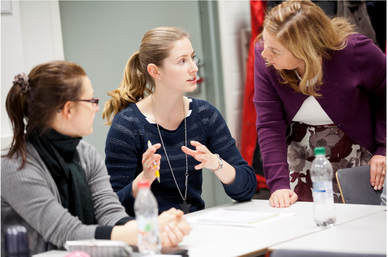
KUVA 1. Opettaja valitsee ohjausmuodon opiskelijan ohjauksen tarpeen mukaan

tarpeiden mukaan. Ohjaajan tulee tunnistaa opiskelijan ohjaustarve ja valita kullekin opiskelijalle juuri hänelle sopiva ohjausmuoto. (Kuva 1.)