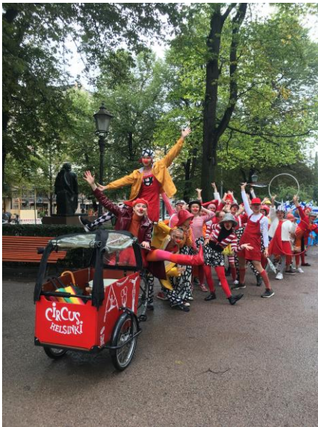
Kuva 1 Esiintyvän ryhmän nuoret esiintyjät pääsevät harjoittelemaan esiintymistä niin sisä- kuin ulkolavoilla.

30 oppilaan Esiintyvä ryhmä harjoittelee 12 tuntia viikossa kolme tuntia kerrallaan, ja oppilaat ovat 10–20-vuotiaita. Vakituksia opettajia ryhmällä on tällä hetkellä 4. Lisäksi vierailevat opettajat tuovat ryhmän harjoituksiin variaatiota ja uusia lajeja. Esiintyvän ryhmän opetus on esityspainotteista ja ryhmä esiintyy useita kertoja vuodessa Circus Helsingin omissa tapahtumissa, erilaisissa ulkopuolisissa tapahtumissa ja festivaaleilla niin Suomessa kuin ulkomailla. Opetus- ja kulttuuriministeriö on nimennyt Circus Helsingin Esiintyvän ryhmän Nuori Suomi -kulttuurilähettilääksi.