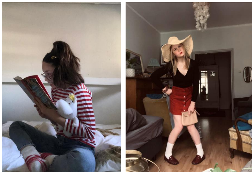
Kuvat 6 ja 7. Puvustuksen kautta rakennettuja hahmoja etäopetuskaudelta. Rekvisiitan avulla luodaan katsojille mielikuva siitä, millainen hahmo on. Kuvassa "Nelli Nörtti" korostaa hahmoaan silmälasien ja kirjan avulla, kun taas käsilaukku ja lierihattu luo mielikuvan hienostorouva "Agathesta".

Circus Helsingillä on oma laaja puvusto, joka on vuosien mittaan rakentunut vastaamaan etenkin Esiintyvän ryhmän esiintymistarpeisiin. Osana kehitysprojektia pyysin opettajia esittämään toiveita rekvisiitasta ja puvuista eri teemaisiin esityksiin, jotta puvusto saataisiin laajennettua myös TPO-ryhmien käyttöön paremmin soveltuvaksi. Valmistuessaan puvut ja rekvisiitta tuodaan helposti saavutettavaksi joko tuomalla materiaali alas varastoista tai kuvaamalla käytettävissä oleva materiaali esiintymisharjoitusten työkalupakkiin, jolloin ryhmät voivat esityksiä suunnitellessaan valita kuvien avulla, mitä pukuja haluavat käyttää.