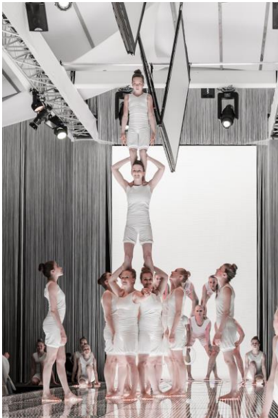
Kuva 2 Korkea tekninen taso ja vahva ilmaisu luo mahdollisuuksia esiintyä erilaisissa tilausnäytöksissä. Kuvassa esiintyvän ryhmän Verso-esitys Millenium-palkintogaalassa.

Kehittämistyön tavoitteena on luovien ilmaisu- ja esitysharjoitteiden tuominen säännölliseksi osaksi kaikkien ryhmien harjoituksia. Esiintymisharjoitusten tuominen luonnolliseksi osaksi opetustuntia saa oppilaat tottumaan esiintymiseen ja poistaa jännitystä ja painetta kevätjuhlaesityksestä. Tavoitteena on, että kaikki sirkuskoulun oppilaat saisivat paitsi teknistä opetusta myös monipuolista luovuutta ja esiintymistaitoja kehittävää opetusta. Kehittämistyön pitempiäaikaisena tavoitteena on opetuksen ja esitysten taiteellisen laadun kehittäminen. Luomalla taiteellisesti korkeatasoisia esityksiä ryhmille avautuu heille mahdollisuus esiintyä myös muissa tilaisuuksissa kuin kevätjuhla viikon oppilasnäytöksissä kerran vuodessa. Pyrkimyksenä on luoda oppilaille nykyistä enemmän esiintymismahdollisuuksia.