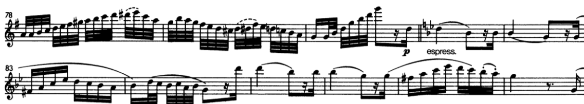
KUVA 3. Mollivariaatio (g-molli). Tahdit 81–88.

Sitten Kuhlau lähtee muuntelemaan teemaa oktaavihypyin ja rytmikan keinoin. Variaatioita seuraa kolmaskymmeneskahdesosanuottijuoksutus, joka johtaa tee- man mollimuunnelmaan.